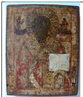
Fig. 5 Urme de veșmânt vermillon, icoana Sfântul Ierarh Nicolae (sec. XVIII)

Alți autori explică modificările de culoare (tente de cenușiu) în cazul picturii murale prin formarea unui strat superficial de Hg coloidal în cinabru, sub acțiunea luminii. Procesul este influențat de halogenii prezenți, ca impurități provenite din material sau microclimat (prezența ionilor de clor în concentrații mai mari de 0,05%), de unele săruri alcaline și anumiți compuși organici. În prezența luminii și a concentrațiilor ridicate de clor, produșii intermediari \text{Hg}_3\text{S}_2\text{Cl}_2 și \text{Hg}_2\text{Cl}_2 conduc la formarea produsului final \text{HgCl}_2 de culoare albă 8 . În timp ce un volum de carte prezintă formatul care asigură o mai mare protecție a stratului sau straturilor succesive de pigmenți din miniaturi, în cazul icoanelor ( Fig. 5 ) acțiunea directă a acestora la acțiunea radiațiilor din domeniul UV-Vis trebuie evitată prin asigurarea unui microclimat corect în depozitare sau expunere și evitarea contactului cu halogeni.