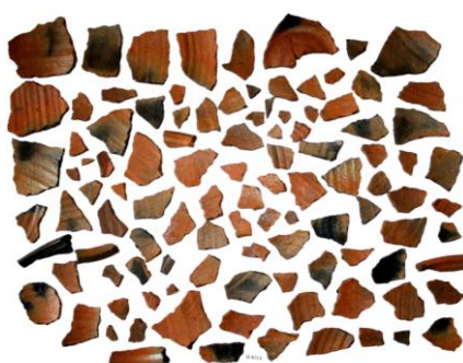
Fig. 3-4: Piesa în timpul restaurării (interior și exterior) (Foto: Terezia Simon)

Restaurarea vasului a început cu înlăturarea depunerilor de sol de pe fiecare fragment prin pensulări ușoare, spălarea cu apă distilată și curățarea lor folosind instrumentar de detartraj adecvat, sub microscop. După băile repetate de apă distilată și testul clorurilor, neevidențiindu-se prezența acestora, fragmentele au fost