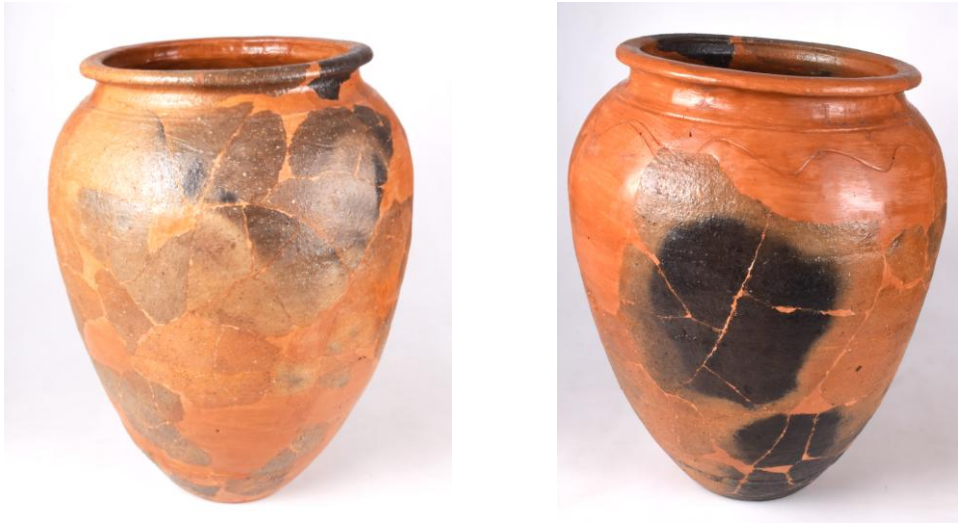
Fig. 9-10: Piesa după restaurare

Din punct de vedere al valorificării expoziționale, acest vas a participat în anul 2015 la Salonul Național de Restaurare organizat de Muzeul Olteniei Craiova 2 .