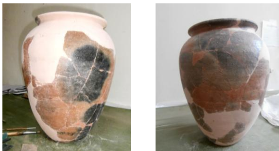
Fig. 7-8: Piesa în timpul completării formei

După asamblare a urmat completarea spațiilor goale dintre fragmentele descoperite, ce au recompus circa 65% din întreg. Completarea s-a efectuat cu ipsos de modelaj, mojarat cu pigmenți la o nuanță apropiată ceramicii. Continuarea decorului incizat pe completări s-a efectuat cu instrumentar adecvat, iar finisarea completării cu hârtie abrazivă de diverse granulații ( Fig. 7-8 ).