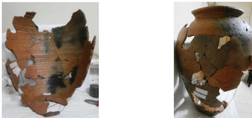
Fig. 5-6: Piesa în timpul restaurării – asamblarea și inserarea armăturilor

S-a continuat cu identificarea și asamblarea fragmentelor, care datorită lipsei materialului original a impus inserarea unor armături din sârmă neferoasă de grosime adecvată ( Fig. 5-6 ).