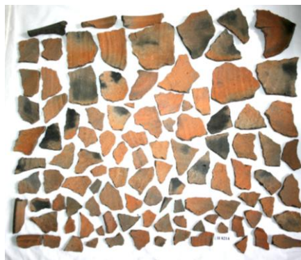
Fig. 1-2: Piesa înainte de restaurare (interior și exterior)