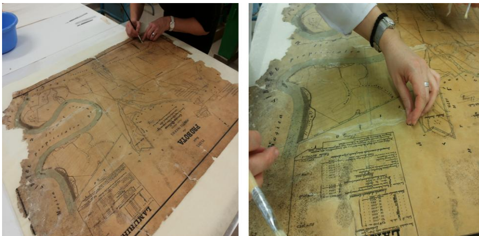
Fig. 5 – Avers lucrare; îmbinarea fragmentelor documentului