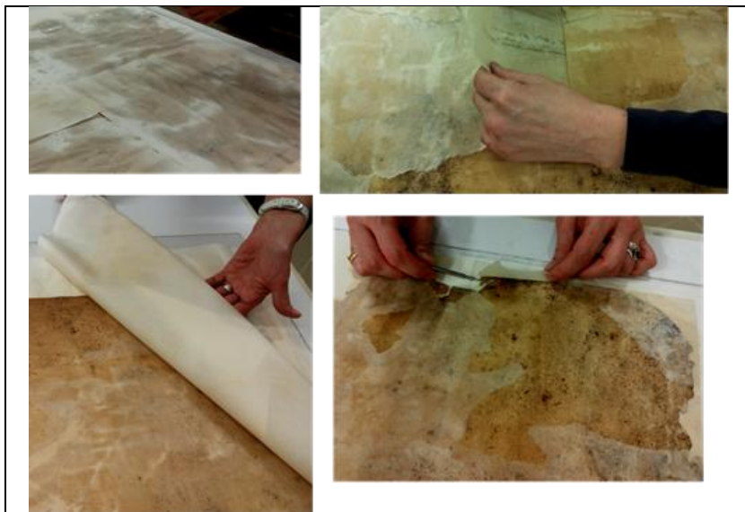
Fig. 3 – Umidificarea lucrării și înlăturarea consolidărilor anterioare de pe versoul documentului

- stabilizarea lucrării prin consolidare și neutralizare, utilizând tehnica ”facing” de consolidare a aversului, tehnica de cașerare umedă, iar ca materiale și substanțe hârtie japoneză și soluție apoasă pe bază de metilceluloză și oxid de calciu (Fig. 4).