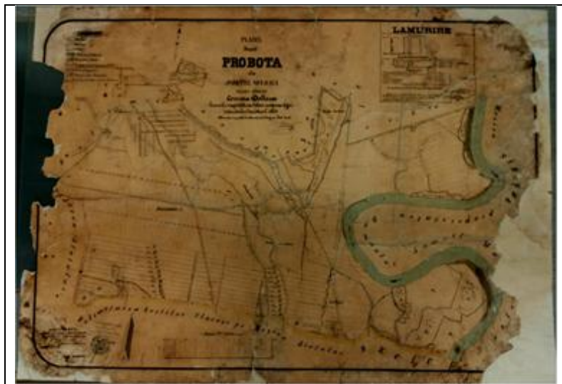
Fig. 1 – Planul moșiei Probota din județul Suceava, 1889 (aspectul lucrării restaurate înainte de noile intervenții de conservare-restaurare)