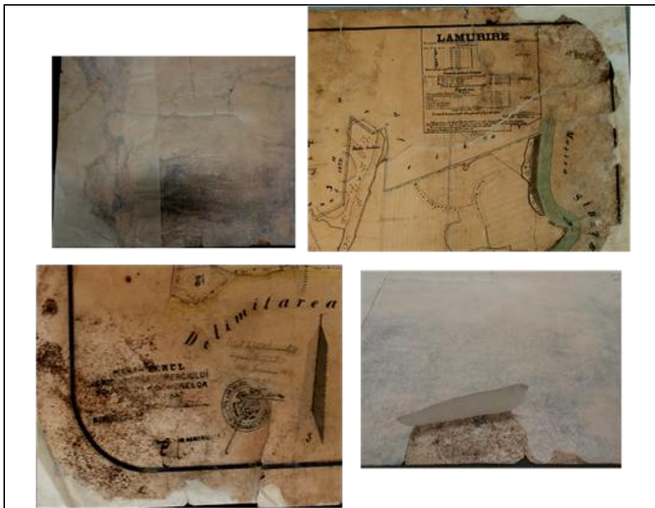
Fig. 2 – Tipuri de degradări întâlnite pe aversul și verso-ul documentului