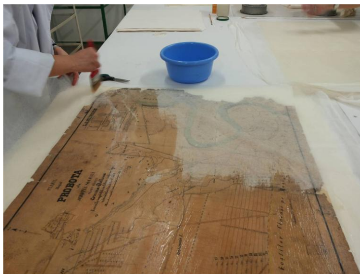
Fig. 4 – Consolidarea aversului documentului cartografic prin tehnica ”facing”

- stabilizarea lucrării prin consolidare și neutralizare, utilizând tehnica ”facing” de consolidare a aversului, tehnica de cașerare umedă, iar ca materiale și substanțe hârtie japoneză și soluție apoasă pe bază de metilceluloză și oxid de calciu (Fig. 4).