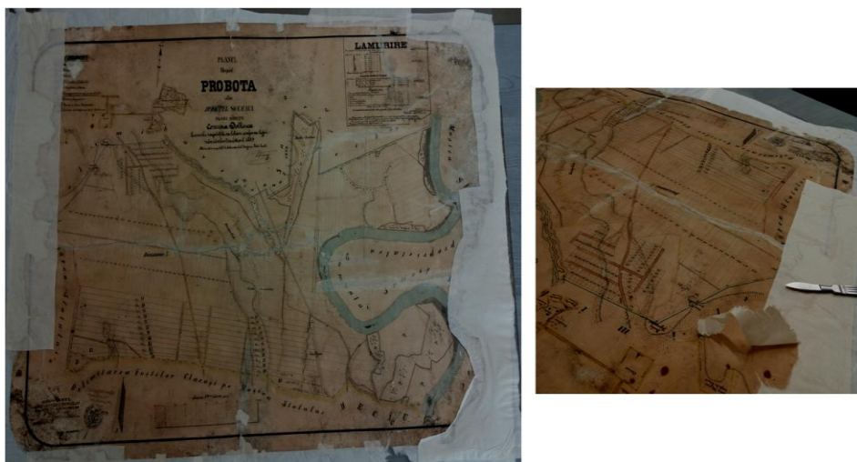
Fig. 6 – Suportul hărții după stabilizarea suportului, în decursul înlăturării surplusului de hârtie japoneză