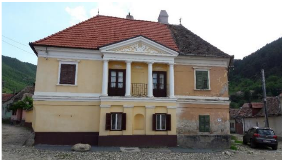
Fig. 21 – Casă (1850) din Rășinari

Amplasamentul casei din 1850 se află în centrul satului, lângă „Scaunul bisericii”, în vecinătatea imediată a „Sfintei Paraschiva”, aproape de Școala unde după renovarea din 1850 a început a funcționa biroul Primăriei, și aproape de Casa Episcopală din Rășinari.