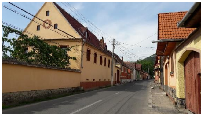
Fig. 27 – Podul cu data refacerii casei lui Ilarie Mitrea (1861)

Casa din 1842, în care a văzut lumina zilei Ilarie Mitrea, a fost însă, de fapt, reconstruită în anul 1861, conform datei înscrise pe acoperișul casei. În zilele noastre casa particulară a suferit drastice renovări moderne. Nici aici, nici în altă parte nu funcționează nicio casă memorială Ilarie Mitrea, așa cum s-ar cuveni pentru omagierea valorosului medic și naturalist, explorator și colecționar român.