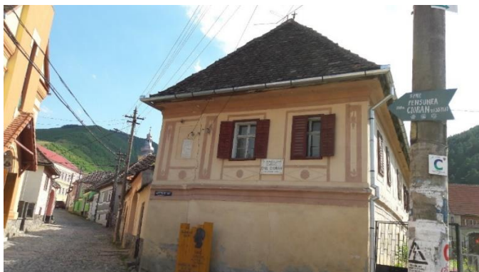
Fig. 15 – Casa lui Iacob Ciucean (1846), casa natală a lui Emil Cioran (1911), din Rășinari.

Casa, aflată în centrul satului, la capătul uliței coborând de la Școală și de la Biserica „Sfânta Paraschiva” spre podul de la Valea Caselor, a fost construită de Iacob Ciucean în 1846.