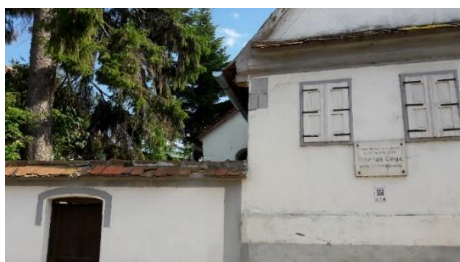
Fig. 29 – Casa natală a lui Octavian Goga (ante 1881) din Rășinari

Aproape de centrul satului se află casa natală a lui Octavian Goga. Plăcuța de marmură, nedată, de pe peretele alb al fațadei de la stradă, ne informează că este vorba despre: