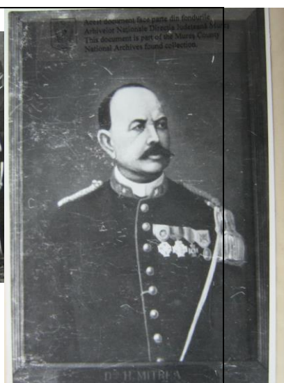
Fig. 26 – Hilarion Mitrea în uniforma de general medic al armatei olandeze

Casa din 1842, în care a văzut lumina zilei Ilarie Mitrea, a fost însă, de fapt, reconstruită în anul 1861, conform datei înscrise pe acoperișul casei. În zilele noastre casa particulară a suferit drastice renovări moderne. Nici aici, nici în altă parte nu funcționează nicio casă memorială Ilarie Mitrea, așa cum s-ar cuveni pentru omagierea valorosului medic și naturalist, explorator și colecționar român.