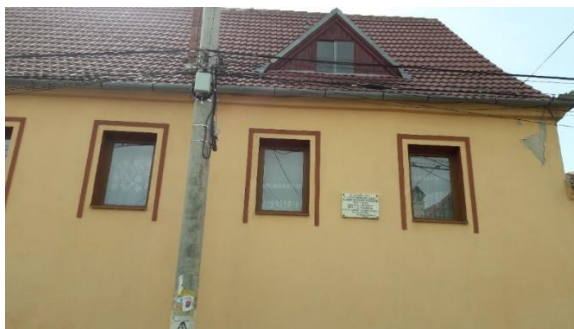
Fig. 23 – Casa natală a lui Ilarie Mitrea (1842) din Rășinari