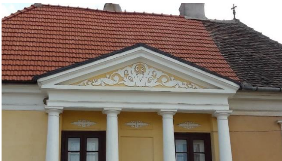
Fig. 22 – Frontonul cu datarea casei (1850)

Amplasamentul casei din 1850 se află în centrul satului, lângă „Scaunul bisericii”, în vecinătatea imediată a „Sfintei Paraschiva”, aproape de Școala unde după renovarea din 1850 a început a funcționa biroul Primăriei, și aproape de Casa Episcopală din Rășinari.