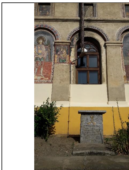
Fig. 17 – Postamentul cu inscripţie, lângă Biserica „Sfânta Paraschiva” din Răşinari.

Postamentul vechi de piatră, pomenit mai sus, se găseşte şi poate fi văzut pe latura din dreapta intrării în Biserica „Sfânta Paraschiva” din Răşinari, în exteriorul