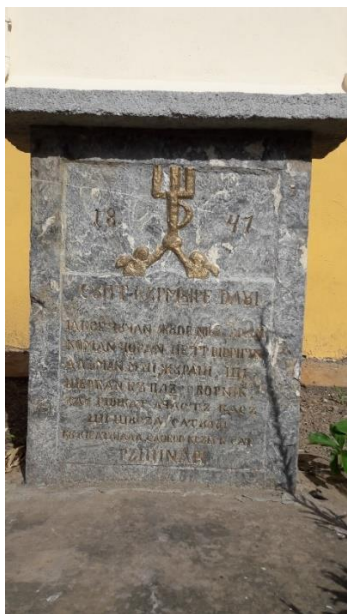
Fig. 18 – Inscripția Casei și Șurii Satului din Rășinari (1847)