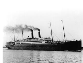
Vasul Amerika – 1902

Ajunși pe vapor, erau trecuți pe listele de pasageri, care cuprindeau date cu caracter personal, având 23 de rubrici: 1. Numărul pe listă; 2. Numele întreg; 3. Vârsta (anul, luna); 4. Sexul; 5. Căsătorit sau nu; 6. Meserie ori profesie; 7. Dacă știe să citească și să scrie; 8. Țara și naționalitatea (de ex., Ungaria, român); 9. Rasa persoanei; 10. Ultima reședință (permanentă, țara și orașul sau localitatea); 11. Destinația finală (statul și orașul); 12. Dacă are bilet până la destinația finală; 13. De către cine i-a fost plătită călătoria; 14. Dacă are 50 de dolari?, iar dacă sunt mai puțini, cât? 15.