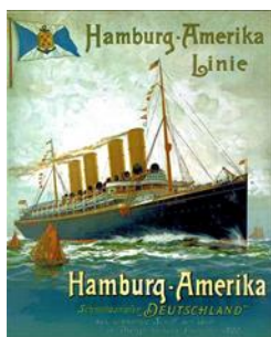
Reclamă companie de vapoare

Lipsa acută de forță de muncă și deficitul de populație cu care se confrunta în perioada respectivă SUA au avut un efect deosebit asupra emigrației din zona Făgărașului. La crearea unui climat favorabil emigrării au contribuit atât mirajul „țării libertății și a tuturor posibilităților” 13 , cât și reclama agresivă a agenților de emigrare sau ai diferitelor companii de vapoare care îndemnau populația să ia drumul Americii. Găsirea rapidă a unui loc de muncă și posibilitatea de a face „mia și banii de drum” 14 , cu care să-și salveze proprietatea prin plățirea datoriilor, dar și să achiziționeze pământ, inventar agricol, animale și să-și modernizeze gospodăriile, au determinat pe mulți făgărașeni să rezolve „ieșirea din situația economică grea prin plecarea spre America” 15 .