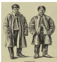
Români în SUA – 1881

Emigrarea a fost deosebit de accentuată în comitatele Târnava Mare și Mică, Bihor, Alba de Jos, Făgăraș și Caraș-Severin, „predominând numărul bărbaților, 68%, față de numai 32% cât au reprezentat femeile între 1898-1913” 7 .