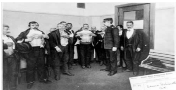
Ellis Island – inspecție medicală (1902)

Cei din Vad, conform datelor care le avem din tabelul pe care l-am realizat (vezi mai jos) cu cei care au intrat în America prin Ellis Island, au avut ca principale destinații următoarele orașe: New Philadelphia, Ohio – 97 persoane; McKees Rocks, Ohio – 27; Dundee (azi Wayne), Ohio – 24; Layland, Ohio – 6; Salem, Ohio – 3; Steubenville, Ohio – 3; Barrs Mills (azi Tuscarawas), Ohio – 2; Newark, Ohio – 2; Warren, Ohio – 2; Youngstown, Ohio – 1; Danville, Ohio – 1; Alliance, Ohio – 1; Greentown, Ohio (în actualul district Stark, parte din Canton-Massillon) – 1; Zanesville, Ohio – 1; Allegheny (la granița cu Ohio) – 1; Homestead 23 , Philadelphia – 1; Joliet, Illinois – 2; Gary, Indiana – 4; Washington – 2; New York – 3; Chicago – 1; Michigan – 5.