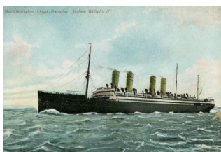
Vasul Kaiser Wilhelm II

Cei care se pregăteau de plecare din satele făgărășene, aici incluzând și pe cei din localitatea Vad, mergeau în primul rând la Făgăraș, de unde își cumpărau „haine nemțești” 20 , apoi luau trenul spre Budapesta sau Viena, de unde erau preluați de către agenții companiilor de vapoare, fiind îndreptați spre porturi precum Fiume (Rijeka), Bremen și Hamburg. Vădenii au folosit și alte porturi, precum Liverpool, Rotterdam, Le Havre și Trieste, iar mai târziu, după război, Constantinopol și Constanța, de unde se îmbarcau cu destinația SUA.