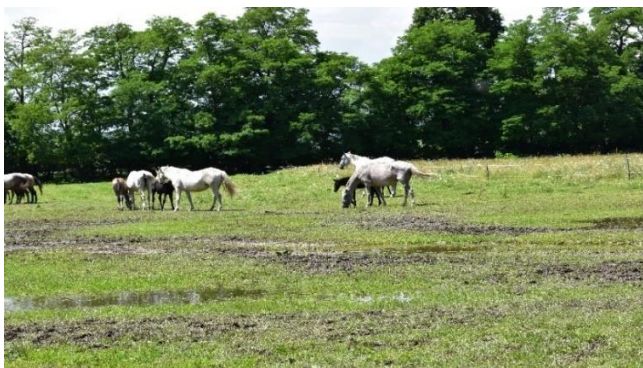
Cai lipițani 2