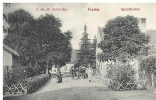
Fogaras: Magyar királyi állami ménestelep. 1908