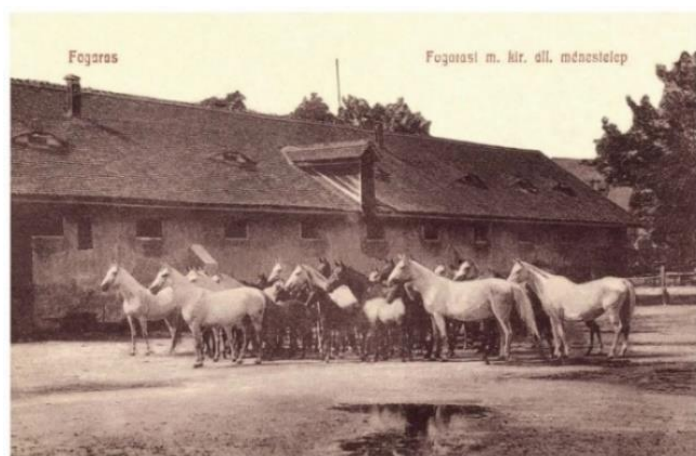
Fogaras: Magyar Királyi Állami ménestelep, 1908.

coroane, dar „cel mai mare preț” au obținut cele două iepe aduse din herghelia făgărășeană, pentru care s-a „plătit suma de 4.700 de coroane” 73 .