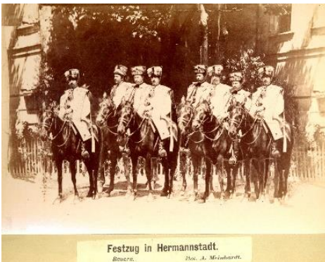
Festzug in Hermannstadt. Bauern. Phot. A. Meinhart.