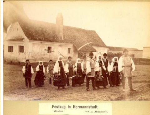
Festzug in Hermannstadt. Bauern.