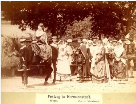
Festzug in Hermannstadt. Bürger.