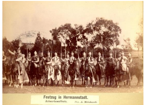
Festzug in Hermannstadt. Schwerbewaffnete.