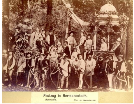
Festzug in Hermannstadt. Hermannii.