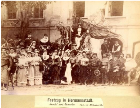
Festzug in Hermannstadt. Handel und Gewerbe.