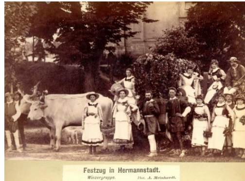
Festzug in Hermannstadt. Wassergruppe.