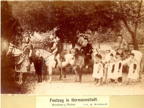
Festzug in Hermannstadt. Hermann u. Pleban.