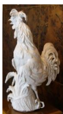
Figurina Cocos de rasă Padovană, Johann Joachim Kaendler, 1732, Palatul Zwinger, Dresda

Astăzi, fabrica de porțelan de la Meissen oferă spre comercializare figurina reprezentând un cocos de rasă Padovană după modelul lui Johann Joachim Kaendler din anul 1732, atât în varianta albă, cât și în cea policromă 36 . Figurinele având o înălțime de 77 cm și o greutate de 19.300 g fac parte „dintr-o colecție exclusivă de figuri mari în ediție limitată” 37 . Fabrica de porțelan de la Meissen se bazează „pe cel mai mare și mai vechi stoc de matrițe de ipsos, modele istorice și șabloane din lume, care pot fi utilizate, printre altele, pentru a reproduce aproape toate formele care au fost create vreodată în fabrică” 38 , „cel mai bun porțelan Meissen” fiind fabricat „manual în mod tradițional” 39 .