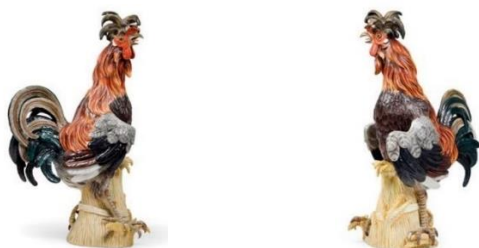
Figurină Cocoș mare de rasă Padovană , a doua jumătate a secolului al XIX-lea ( http://www.dorotheum.com/en/I/6158991/ )

O figurină de porțelan realizată la Meissen în a doua jumătate a secolului al XIX-lea, reprezentând un cocoș de rasă Padovană, cu decor pictat policrom, a participat la expoziția de la Palatul Dorotheum din Viena, în perioada 20 aprilie-2 mai 2019, fiind estimată între 11.000 și 15.000 euro (expert Ursula Rohringer) 40 . Piesa marcată la bază, având o înălțime de 77 cm, realizată după un model de Ernst August Leuteritz din 1854, model nr. B 144, confecționat după un model de J.J. Kändler din 1732, a fost vândută de Casa de licitații Dorotheum, în 2 mai 2019, cu 19.050 euro 41 .