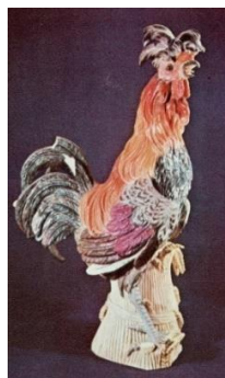
Figurina Cocoș înainte de restaurare (foto: Gabriela Cocora, publicată în albumul Castelul Bran , text Ioan Prahoveanu, 1980)