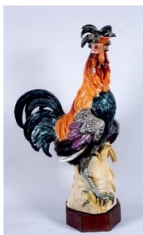
Figurina Cocoș (Muzeul Național Bran, nr. inv. C. 207, foto Árpád Udvardi, 2007)

racteristic pentru figurinele executate în secolul al XIX-lea, care ajută la identificarea modelului 13 , respectiv B 149. Celelalte cifre scrise pe baza figurinei reprezintă numere de inventar.