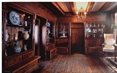
Salonul de Muzică al Castelului Bran

În perioada iunie 2009-iunie 2018, expoziția de ceramică amenajată în pavilionul central al clădirilor Vămii Medievale Bran a cuprins și figurina de porțelan Meissen înfățișând un cocoș. Astăzi, piesa se păstrează într-unul dintre depozitele muzeului, necesitând o intervenție de restaurare.