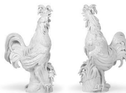
Figurină Cocoș mare de rasă Padovană , 1924-1934 ( https://www.dorotheum.com/it/I/6426446/ )