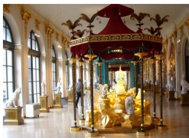
Menajeria de porțelan a regelui Augustus cel Puternic, Palatul Zwinger