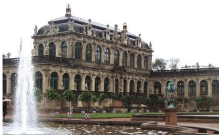
Palatul Zwinger, Pavilionul de porțelan (foto Nicoleta Petcu, 2019)

(...) în 1710 29 , Pavilionul Rampart și Galeria Lungă fiind construite între 1714 și 1716 30 , iar restul „clădirii a fost înălțat în 1718 ca o imagine simetrică în oglindă, înțâi din lemn și apoi din piatră între 1723 și 1728” 31 . Tot aici, „au fost făcute straturi de flori în interiorul curții, (...) pe când locul pentru festivități ocupa centrul zonei” 32 . Artistul Balthasar Permoser, care lucrase în Italia, a supravegheat „detaliile sculpturale” 33 ale Palatului Zwinger. După bombardarea Dresdei din 1945, palatul a fost puternic afectat, restaurarea sa începând la câteva săptămâni după sfârșitul celui de Al Doilea Război Mondial și finalizându-se în 1964 34 . Astăzi palatul adăpostește mai multe muzee, care cuprind galeria de pictură, Cabinetul Regal de Instrumente Matematice și Fizice, colecția de porțelan. Pavilionul de porțelan al Palatului Zwinger găzduiește colecția fondată de regele Augustus cel Puternic în Palatul Japonez, cuprinzând obiecte din porțelan tradițional chinezesc și japonez, printre care se numără vasele chinezești (vaze cu dragoni) preluate de regele Augustus cel Puternic de la regele Frederik William I al Prusiei la schimb cu o unitate de 600 de cavaleriști 35 , colecția de porțelan german, majoritatea piese de Meissen, sculpturi din porțelan, seturi cu ustensile de masă etc.