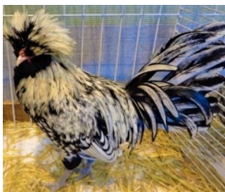
Cocoș de rasă Padovană , penaj argintiu cu marginea neagră ( https://www.domesticforest.com/padovana-chicken )

Cocoșul de rasă Padovană , o pasăre domestică, crescută mai mult în scop ornamental, poartă pe cap un smoc voluminos de pene 4 . Culoarea penajului variază, cele mai frecvente culori fiind alb, negru, auriu cu margine albă sau neagră, argintiu cu margine neagră; penele sunt rotunjite, iar pe spate, spre coadă, sunt grupate, formând o pelerină 5 . Smocul de pene foarte lungi „conferă capului aspectul unei flori de crizantemă la mascul sau de hortensie la femelă” 6 . Această rasă a fost importată din Polonia în jurul anului 1500 de unii cercetători padovani 7 . Datorită prezenței penelor pe cap, care înlocuiesc creasta cărnoasă s-a dovedit a fi o rasă care a tolerat frigul mai mult decât găinile locale, adaptându-se pe teritoriul padovan și „devenind un simbol al identității și legăturii cu orașul Padova” 8 .