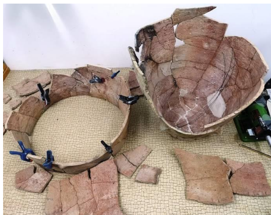
Fig. 3 – Vas de provizii în timpul asamblării în blocuri

Particularitatea dată de arderea secundară deformatoare și dimensiunile vasului au impus montarea unor anse metalice în lacunele mari și utilizarea unor elemente de susținere provizorii în etapa de completare (realizată în poziție orizontală).