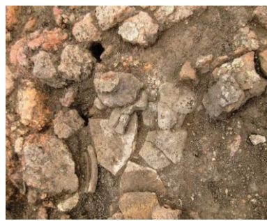
Fig. 1 – Vasul de provizii in situ