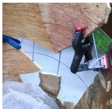
Fig. 4 – Vas de provizii – montare anse de susținere