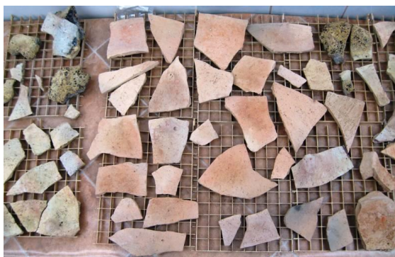
Fig. 2 – Vasul în stare fragmentară

Tratament chimic. Deoarece unele fragmente prezentau depuneri de calcar, s-a impus aplicarea unui tratament chimic de curățare a lor, tratament care s-a realizat prin imersarea fragmentelor în soluție de acid citric 20%. Acest acid nu atacă pigmentii din stratul de decor, poate fi neutralizat ușor și nu este toxic pentru restaurator.