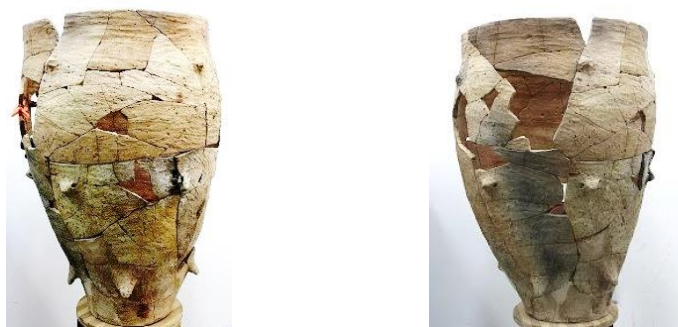
Fig. 6 – Vas de provizii – asamblare finală