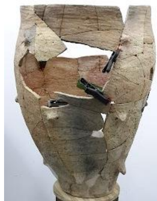
Fig. 5 – Vas de provizii – asamblarea blocurilor