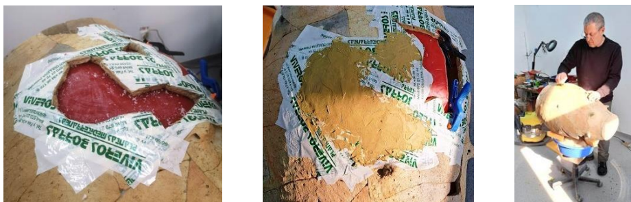
Fig. 8 – Completarea lacunelor cu ipsos, la orizontală