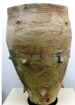
Fig. 10 – Vasul de provizii după restaurare