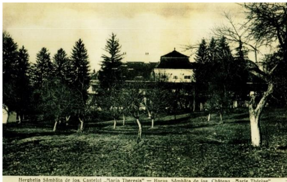
Herghelia Sâmbăta de jos. Castelul „Maria Theresia” — Haras, Sâmbăta de Jos. Château „Marie Thérèse”