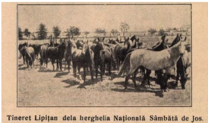
Tineret Lipițan dela herghelia Națională Sâmbăta de Jos. 26

de cai, înființată de contele Brukental, care primise în posesie tot domeniul Făgărașului, pe timp de 99 ani, de la Împărăteasa Maria Tereza” 24 . Apoi, în timpul Primului Război Mondial, au fost amenajate de către „statul Ungar, pentru nevoile armatei și anume pentru spitale de răniți” clădirile și domeniul vechii herghelii desființate. „În anul 1934 constatându-se că herghelia Lipițană s-a dezvoltat mult, calitativ și cantitativ, și grajdurile existente nemai fiind suficiente pentru adăpostirea numărului atât de mare al animalelor, depozitul de armăsari a fost redus, trimițându-se la depozitul Homorod armăsarii de toate rasele, în afară de Lipițani. Astfel nu se mai află la Sâmbăta de jos decât cabaline de rasa Lipițană, în număr total de circa 350 de capete” 25 .