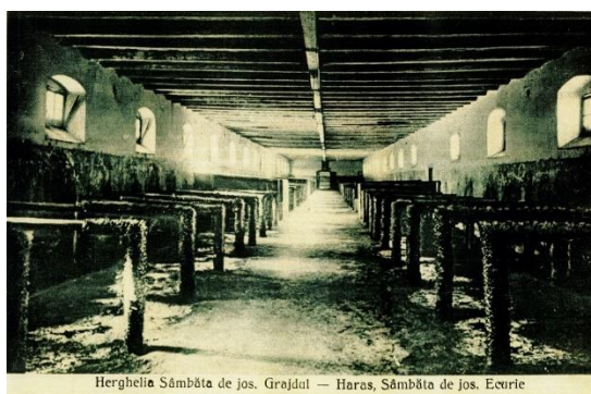
Herghelia Sâmbăta de Jos. Grajdul — Haras, Sâmbăta de Jos. Ecurie