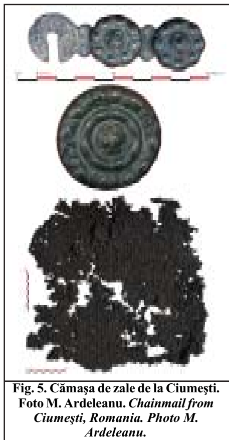
Fig. 5. Cămașa de zale de la Ciumești. Chainmail from Ciumești, Romania.

a atacat insula Als 30 , ulterior anului 350 î.Hr.