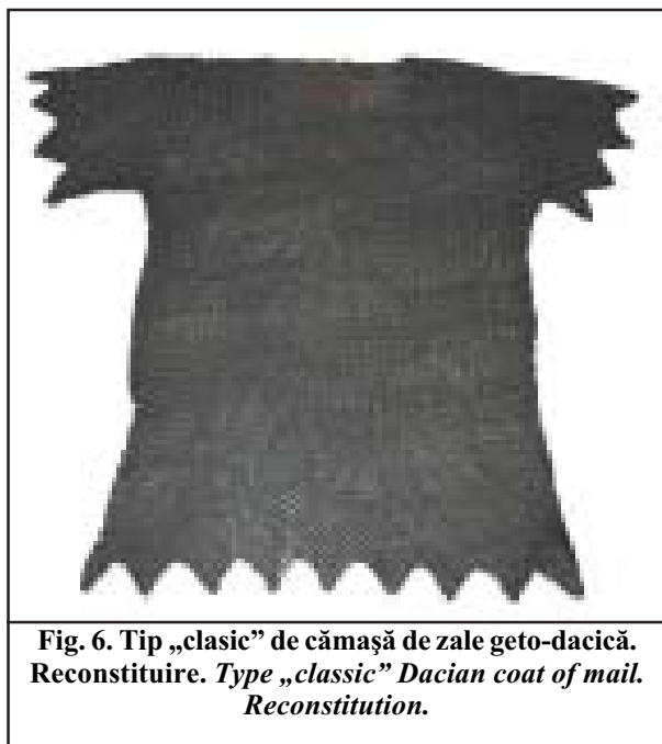
Fig. 6. Tip „clasic” de cămașă de zale geto-dacică. Reconstituire. Type „classic” Dacian coat of mail. Reconstitution.