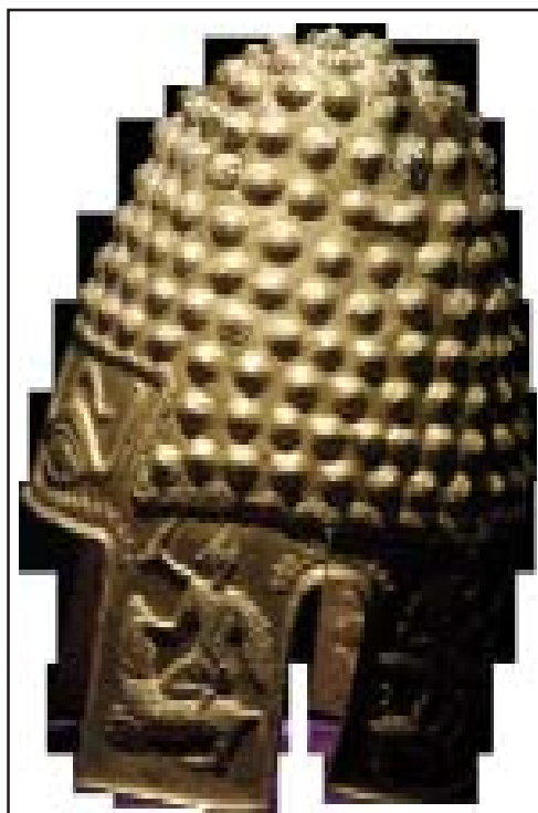
Fig. 10. Coiful de aur de la Poiana-Coțofenești. Propunere de reconstituire calotă de Radu Oltean. Gold helmet of Poiana-Coțofenești. Proposal for reconstitution by Radu Oltean.