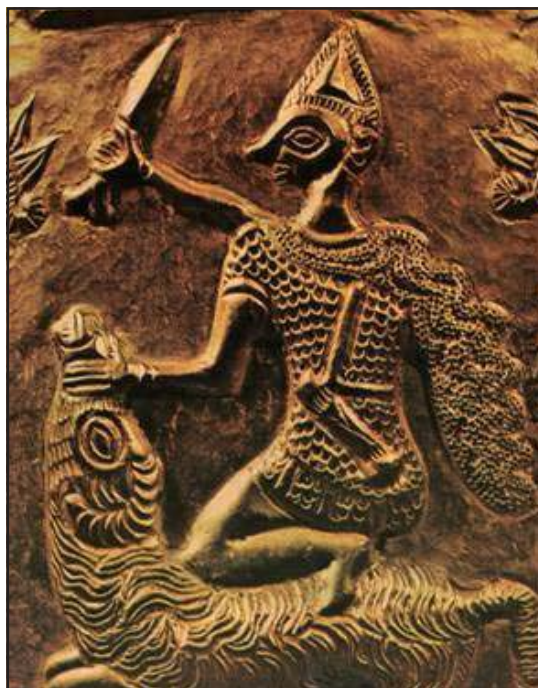
Fig. 9. Coiful de aur de la Poiana-Coțofenești. Detaliu. După Miclea și Florescu 1980. Gold helmet of Poiana-Coțofenești. Detail. After Miclea, Florescu 1980.

Cămășile de zale, ale geto-dacilor în acest caz, par să fi avut un rol important în timpul regalită-