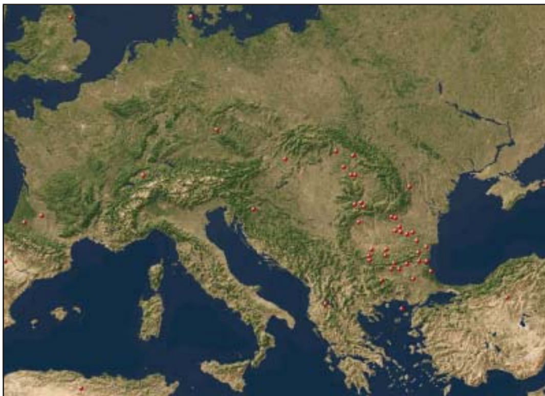
Fig. 3. Descoperiri de armuri de zale din Europa, în perioada Latene. Geographical distribution of chain mail armor in ancient Europe.

Așa explicau anticii forma Zalmoxis , căci acest zeu trac se va fi acoperit cu o blană de urs, zalmos , conform unor tradiții – naive, evident – care circulau în lumea grecească 9 . Sau era „apărătorul, protectorul” 10 . Cuvintele existau, în mod cert, altminteri grecii nu ar fi făcut asocierea Zalmoxis ~ zalmos , după cum, știm azi, forma Zalmoxis este metateza formei Zamolxis , rădăcină ie. *ōem „pământ”. Din analiza acestor forme putem conchide, cu prudența de rigoare, desigur, că în tracă și rădăcina zam ol „pământ” și rădăcina zal m „protecție; zale” aveau sens și erau asociate unor cuvinte uzuale, ale lexicului comun. Rom. zale , cu sing. refăcut za după modelul zile ~ zi , stele ~ stea , șale ~ șa continuă ter-