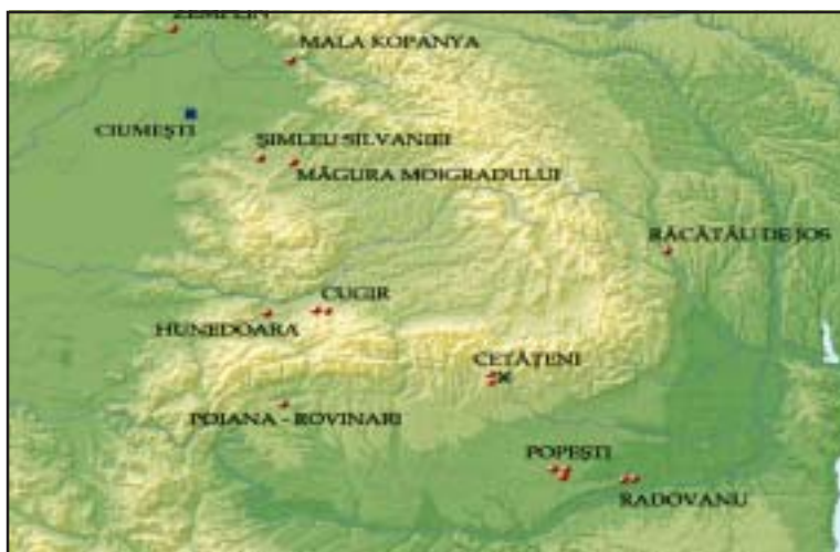
Fig. 1. Distribuția geografică a descoperirilor de armuri de zale din nordul Dunării (* piesă incertă). Geographical distribution of chain mail armor North of the Danube (* uncertain item).

magico-religioase și sociale al căror sens și importanță pot fi, cel mult, bănuite. Plecând de la aceste premise, se poate contura imaginea războinicului ca membru marcant al comunității, exponent al autorității, cu îndatoriri preponderent sau exclusiv militare. Caracterul neomogen al structurilor sociale și militare care îl conțin, poate fi surprins, fie și numai parțial, pe baza a armamentului depus în morminte, la care se pot adăuga particularitățile evidente ale armelor sau influențele alogenilor ori vecinilor. Dispersia în profil teritorial (Fig. 1; Fig. 2) a scos în evidență, la