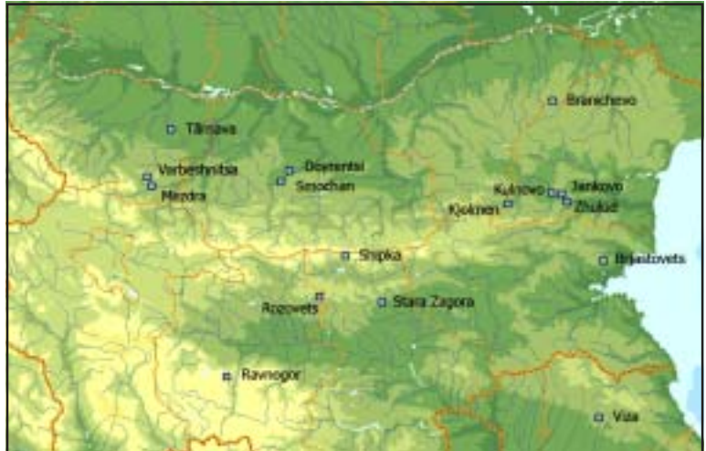
Fig. 2. Distribuția geografică a armurilor de zale din sudul Dunării. Geographical distribution of chain mail armor south of the Danube.