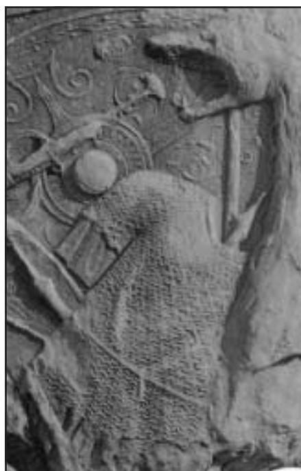
Fig. 7. Armură de zale figurată pe Columna lui Traian. Body armor figured on Trajan's Column.

Din fericire au fost descoperite și armuri întregi, astfel că se poate stabili, cu o mare probabilitate, morfologia cămășilor de zale utilizate de către geto-daci. Aceste echipamente au forma unor tunici (Fig. 6), cu mâneci scurte. Pentru această morfologie pledează și lipsa aproape generală a pieselor ce formau sistemul de închidere, în contrast cu zona sudică, tracică, unde cămășile cu suprapuneri peste umeri par dominante. Această concluzie este sprijinită și de redările cămășilor de zale capturate, figurate pe Columna traiană (Fig. 7). Diferențierea mor-