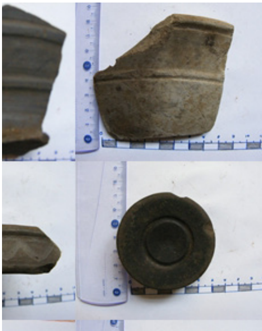
Fig. 5. Fragmente ceramice sarmatice