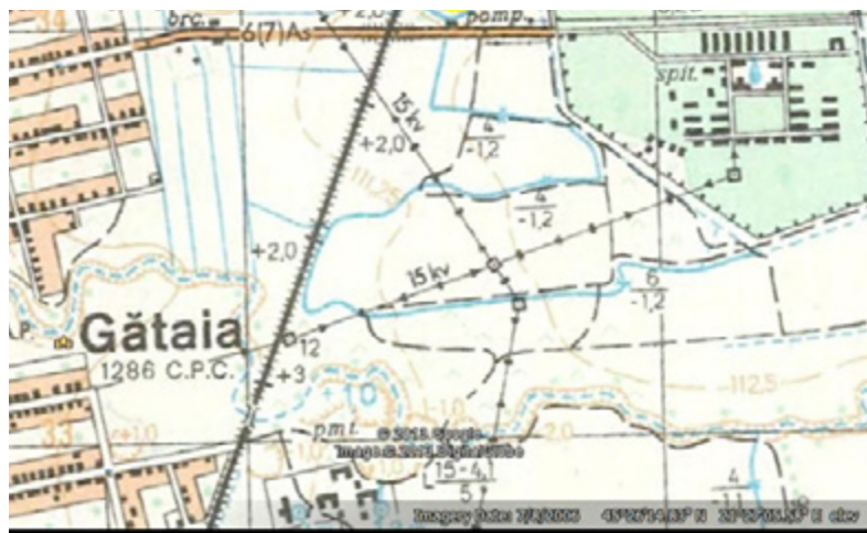
Fig. 1. Harta topografică 1:25.000 (1975) :