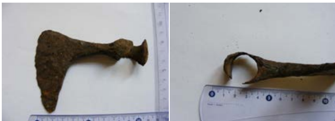
Fig. 2. Toporul nr. 2 de la Gătaia - La Pădure/Cotul Boilor

de conservare este proastă, datorită depunerilor de rugină, gaura de înmănușare fiind ruptă într-una din părți, cel mai probabil din cauza degradării fierului în urma unei folosiri îndelungate, dimensiunea ei fiind de 2,3 x 2 cm. După forma manșonului, este posibil ca piesa să fie de factură avară, dar fără un argument clar (îndeosebi contextul arheologic), aceasta rămâne doar o presupunere. Cel de-al doilea topor este din fier, lucrat prin turnare, având o muchie dreaptă, iar cealaltă curbată spre lamă, cu gaura de înmănușare transversală. Gaura de înmănușare este rotundă, având dimensiunea de 3,5 x 2,2 cm, capătul inferior al toporului luând o formă aproximativ trapezoidală. Taișul prezintă urme accentuate de degradare a fierului datorită depunerilor de rugină. După formă, poate fi un topor de luptă medieval, dar lipsa contextului descoperirii acestuia face dificilă atribuirea sa unei anumite epoci. Dimensiunile topoarelor sunt următoarele: Toporul 1: lungimea totală - 12 cm, lungimea tăișului transversal - 9 cm; Toporul 2: lungimea totală - 15 cm, lungimea tăișului transversal - 7 cm.