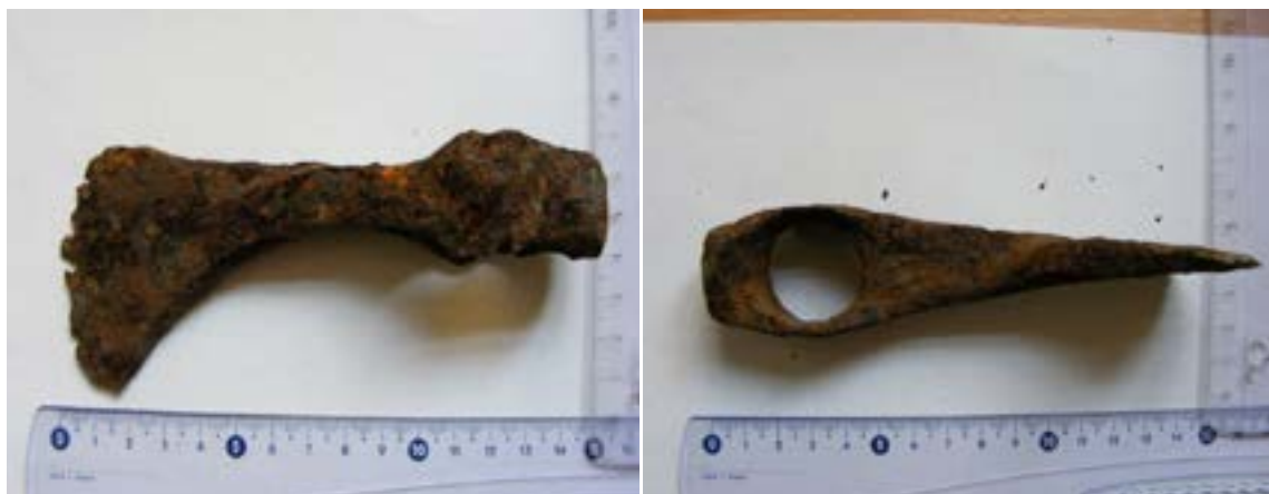
Fig. 1. Toporul nr. 1 de la Gătaia - La Pădure/Cotul Boilor

Topoarele au fost descoperite în punctul Cotul Boilor , în apropierea unor aglomerări de ceramică sarmatică de secol III-IV și ceramică medievală târzie. Primul dintre topoare este din fier, lucrat prin turnare, cu muchiile rotunjite, de formă aproximativ triunghiulară și gaură de înmănușare transversală de formă rotundă. Prezintă urme de folosire, iar starea