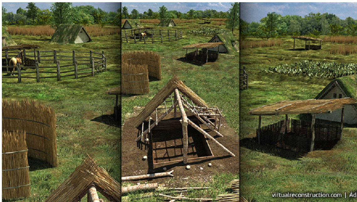
Planșa IV: Reconstrucția virtuală a unui sat barbar (apud http://virtualreconstruction.com/wp/?p=170 )