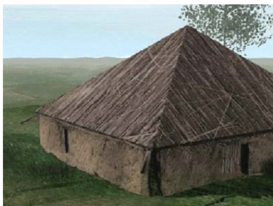
Planșa II: Tipuri de locuințe de la Čurug – Stari Vinogradi (apud Trifunović 2006, în http://curug.rastko.net/index_en.html )