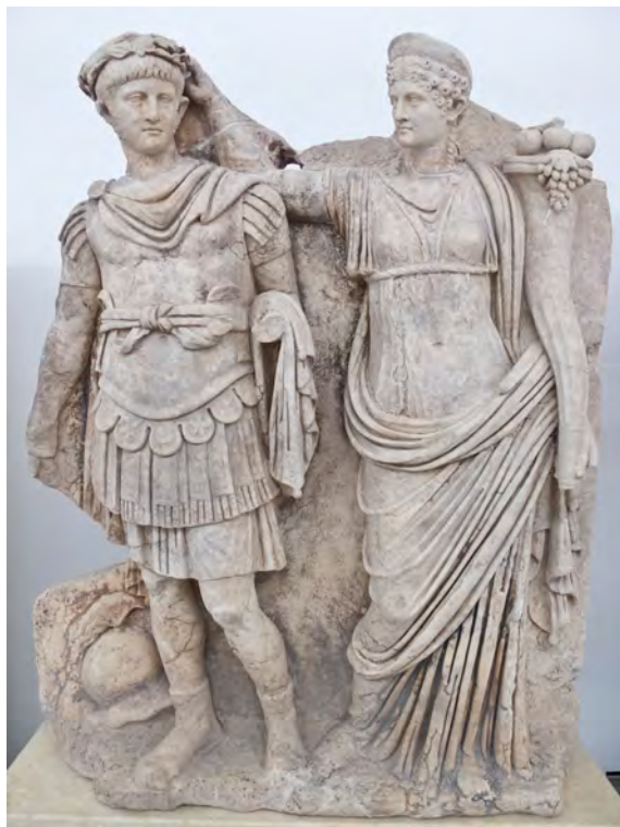
Nero și Agrippina (muzeul din Aphrodisias, Turcia)

Tânăra Agrippina Minor avea să învețe încă din copilărie însemnătatea jocurilor de putere și a intrigilor folosite de către membrii familiei imperiale pentru a-și menține statutul și a-și satisface interesele politice sau chiar dorințele egocentrice. În momentul