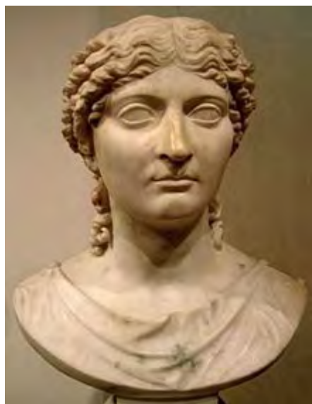
Agrippina (Muzeul Național din Varșovia, Polonia)