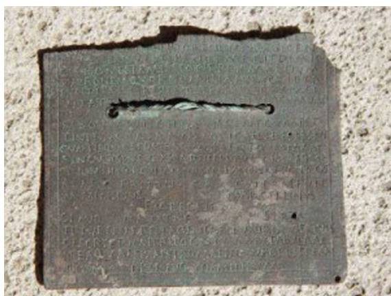
Constitutio Provinciae, 11 august 106

aceeași macroregiune mai sunt atestate cazuri de acumulări excepționale de aur – suficient să exemplificăm cu mitologica bogăție a lui Cresus, regele Lydiei de până la cucerirea persană, ori, chiar pe teritoriul geto-dacic, cu legendara îndestulare în aur a agatârșilor.