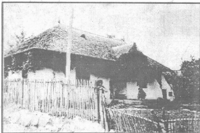
FIG. 5 Casă din Tătărași Pașcani - Iași