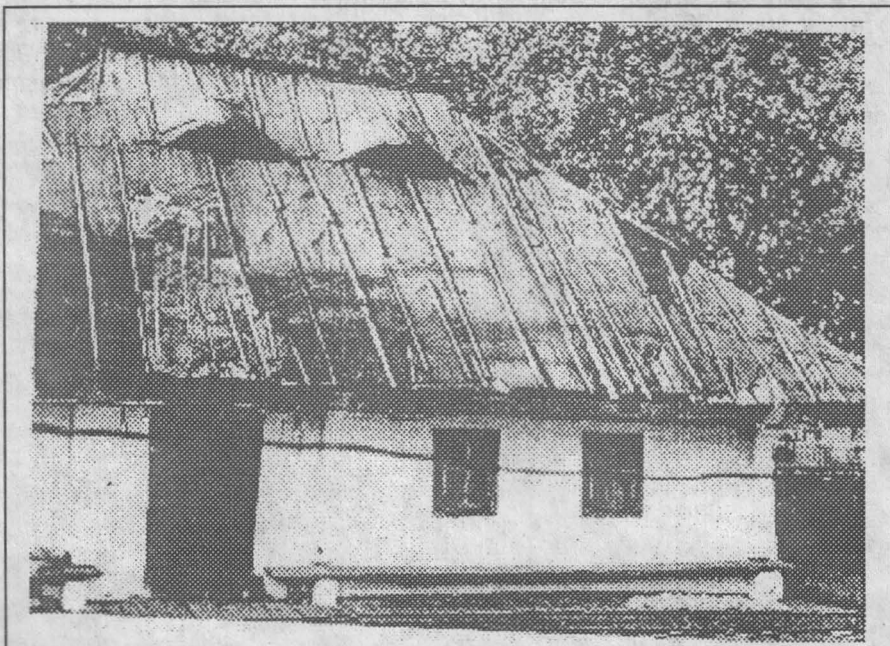
FIG. 2 Casă din bârne în cheutori Vilcovul de sus - Rădăuți

Fig. 1 Maison traditionnelle en bross, village Bivolărie, Vicovul de Sus