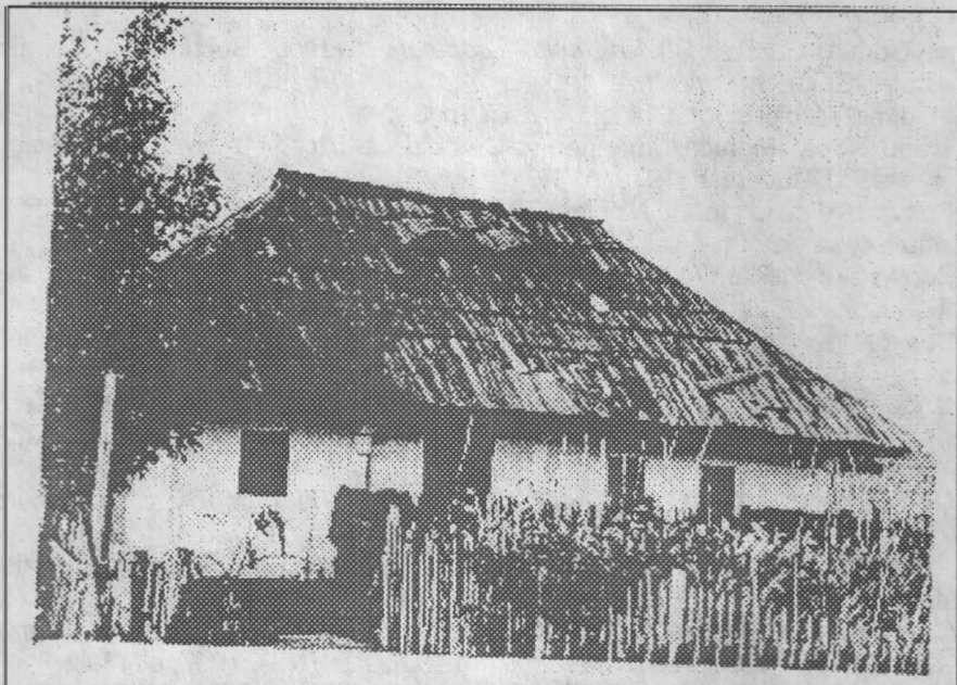
FIG. 1 Casă bătrânească din bârne în cheutori, sat Bivolărie, Vicovul de Sus

Fig. 1 Maison traditionnelle en bross, village Bivolărie, Vicovul de Sus