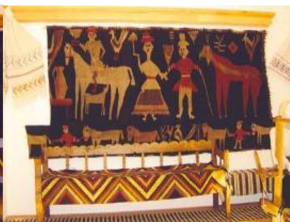
Scoarță, păretar (Petricani – Săveni) și bancă cu spătar