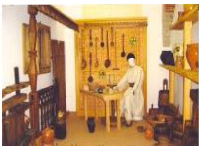
Olar la roată și piese din două suporturi materiale (lutul și lemnul)