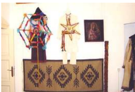
Crăciunul (steaua, luceafărul)