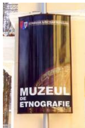
CASA VENTURA (fața) Intrare în muzeu