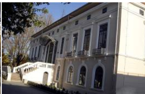
CASA VENTURA (spatele)