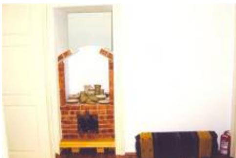
Cuptor pentru ceramică