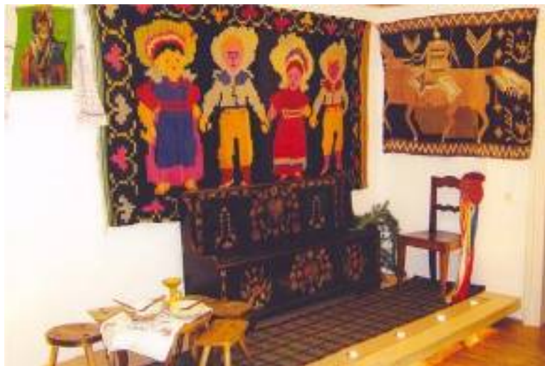
Icoana cu ștergar, covor (comuna Nicșeni), ladă bancă, scoarță (fragment) - călăreț