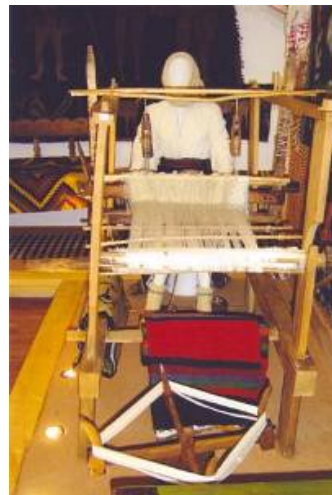
Război orizontal de țesut („stative”)