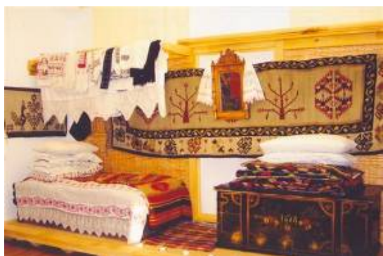
Patul și culmea cu haine; scoarța și oglinda cu ștergar, lada cu zestre