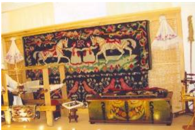
Covor (Brăești), păretar (Cerchejeni) între două ștergare, vârtelniță, ladă pentru zestre, mașină pentru tors