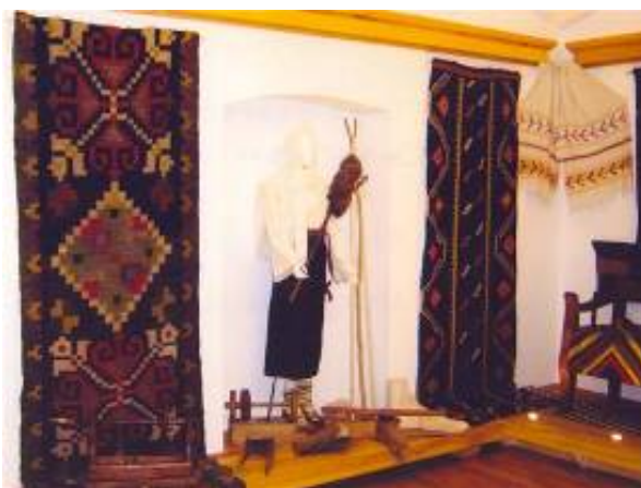
Păretare, manechin cu furcă de tors, „rășchitor”, piepteni pentru câneapă și lână, sucale pentru depănat