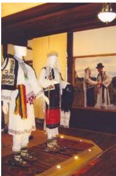
Mire – mireasă