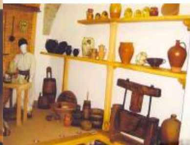
Vase cu diversă utilitate (de vase pentru vin, pentru lapte, chiupuri, ulcior, marcoteț, oală pentru sarmale, lighean pentru frământat aluat, vas pentru ulei; iar de lemn: măsurătoare pentru cereale; piuă pentru grâu, doniță și găleată pentru lapte, untar, teasc pentru ulei)