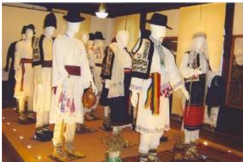
Alai de nuntă