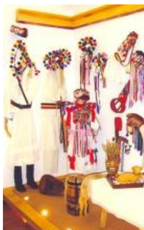
Anul nou (jocurile de căiuți), boboteaza