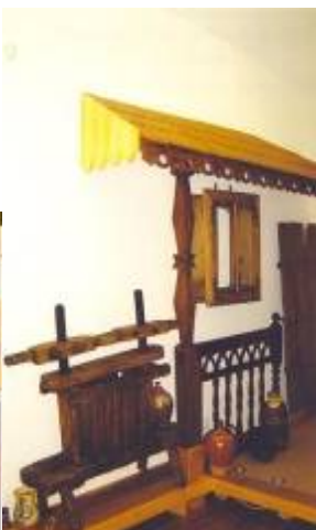
Fațadă locuință, teasc și ceramică: oale