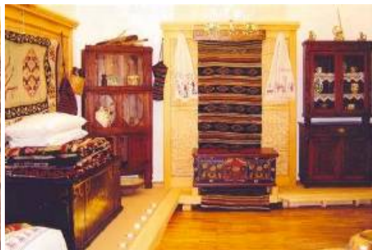
Blidare și ladă mică pentru ștergere și valuri de pânză