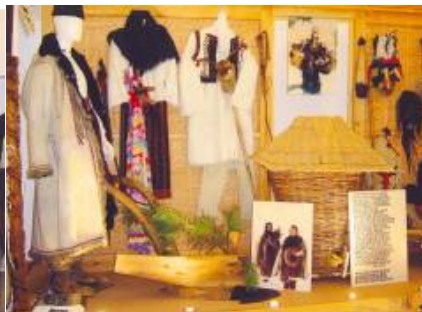
Anul nou (uratul cu plugul, capra, jocurile de măști)