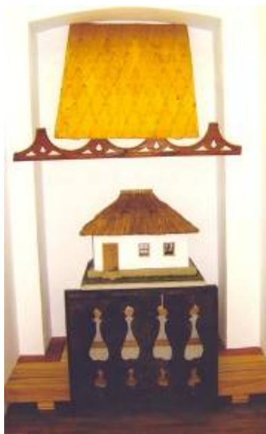
Machetă locuință acoperită cu stuf (cu „tindă” și o cameră, cu prispe în jurul pereților) Fragment de acoperiș cu șindrilă în „bot de rață” Fragment de „pazie” și de cerdac