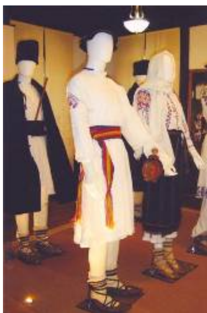
Vornicel și drușcă