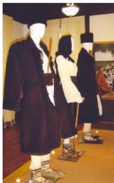
Lăutarii (cobză, fluier) și-o bunică