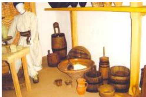
Detaliu: vase pentru grâu, cu făină pentru aluat, pentru lapte, pentru smântână, pentru caș