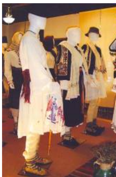
Vornicul mare și nași