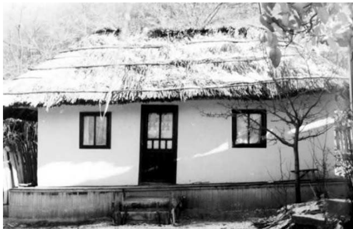
Casă în Budești, sec. XIX, comuna Crețești, Jud. Vaslui, imagine apărută în „Monografia Crețești - Istorie și Actualitate” de prof. Vasile N. Folescu

Sub influența transformărilor de la sfârșitul secolului al XIX-lea, arhitectura populară suportă transformări uneori radicale. Ea reflectă nivelul dezvoltării sociale și puterea economică a țăranului român. În primul rând, transformările sunt evidente la