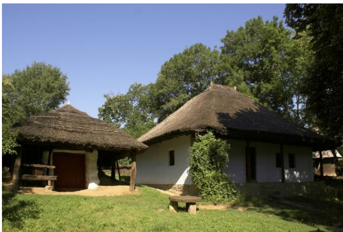
Gospodăria Curteni, 1844, comuna Oltenești, Jud. Vaslui, Muzeul Național al Satului „Dimitrie Gusti” București

Locuința este făcută din cărămidă arsă, o excepție de la tehnica folosită anterior în zonă, cea a construcțiilor din pământ sub diverse forme – ceamur sau chirpici. Casa este ridicată pe temelie de piatră, cu prispă cu patru stâlpi de lemn, fără cerdac. Acoperișul, din stuf, este realizat prin tehnica „la cheptene”. Coama acoperișului este marcată de împletirea ultimului rând de stuf și consolidarea vârfurilor casei. Casa este construită pe un plan patrulater caracterizat de simetrie, cu „sala” mediană și câte două camere de o parte și de alta. Spațiul interior este remarcabil prin următoarele elemente de plastică: forma deschiderilor între camere – goluri arcate, polițe adosate pereților, în partea superioară, modelate din pământ, volumele și formele cuptoarelor, culoarea ocru a lemnului de la scândurile tavanelor și foilor de uși, a ramelor de ferestre, lemn vopsit cu pigmenți naturali, ca și stâlpii de la prispă și capetele grinzilor aparente la exterior 7 . Pardoselile de pământ completează, într-o tonalitate caldă, interiorul locuinței.