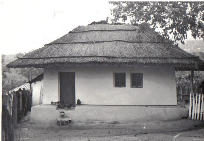
Casa Diaconu N. C-tin, imagine din arhiva etnologului Lucian Valeriu Lefter

Un alt tip de casă este casa cu trei încăperi, cu planul dreptunghiular și tinda la mijloc. În acest caz, tinda devine „sală” cu rol de legătură între cele două camere și de multe ori și către chilerul din spate. În această situație, este locuită numai o singură cameră, căreia i se spune simplu „odaie”, în timp ce a doua cameră care de obicei nu este încălzită, este numită „odaie de oaspeți” sau „odaia curată” și are numai funcția de păstrare a îmbrăcăminte și diferitelor țesături, iar în anumite ocazii de primire a unor oaspeți deosebiți 5 .