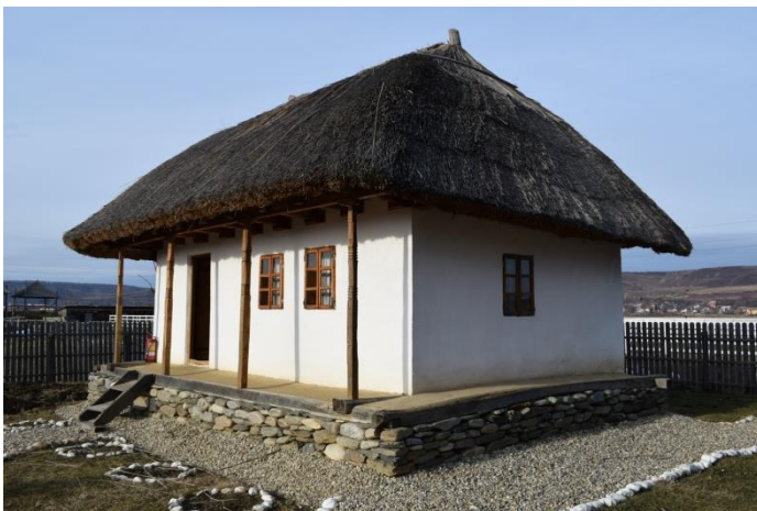
Casă din Zăpodeni, Jud. Vaslui, sec. XIX, Muzeul Viticulturii și Pomiculturii, Golești, Jud. Argeș

Un astfel de exemplu este locuința din Zăpodeni, de secol al XIX-lea, Jud. Vaslui, cumpărată în anul 1995 și ridicată în 1997 la Muzeul Viticulturii și Pomiculturii, Golești, Jud. Argeș.