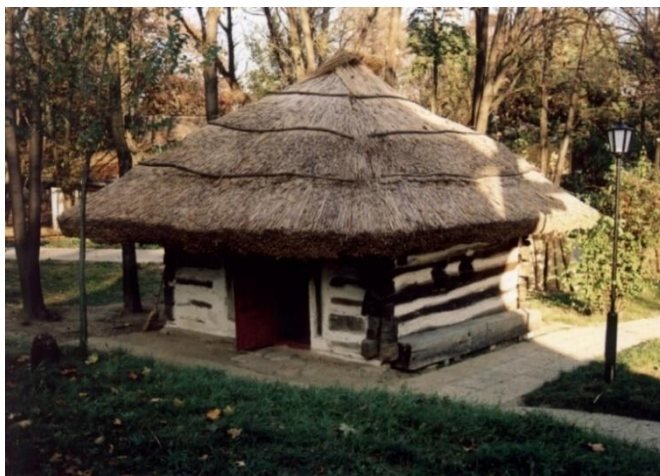
Locuință monocelulară din Zăpodeni, jud. Vaslui, sec. XVII, Muzeul Național al Satului „Dimitrie Gusti” București

Un prim exemplu este locuința monocelulară din Zăpodeni, jud. Vaslui, construcție de la mijlocul sec. al XVII-lea aflată în Muzeul Național al Satului „Dimitrie Gusti” București din anul 1961, ce reprezintă una din cele mai valoroase documente ale arhitecturii populare de pe aceste meleaguri 4 . Casa este construită din bârne masive de stejar, încheiate la capete în „cheotori” drepte și cuprinde o singură încăpere, cu acces direct. Este prevăzută cu ferestre mici, acoperite odinioară cu burduf de oaie. Are acoperiș în patru ape, cu învelitoare din stuf bătut după o veche tehnică, numită „la prăștina”. Streașina este foarte amplă, adăpostind pereții de intemperii. În loc de prispă, element caracteristic al arhitecturii tradiționale românești, acest tip de locuință are o bancă cioplită dintr-un trunchi de stejar.