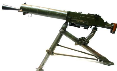
Fig. 2 Mitraliera Schwarzlose md. 1907 cal. 8 mm

Mitraliera utilizată era Schwarzlose model 1907, răcită cu apă, mai puțin performantă (viteza la gură, cadență), dar care a dovedit o mare fiabilitate. În Ungaria, armata noastră a capturat un mare număr (peste 3.000) de astfel de mitraliere. S-au folosit și în Al Doilea Război Mondial, fiind compatibile cu transformarea pentru cartușul cal. 7.92 mm 8 .