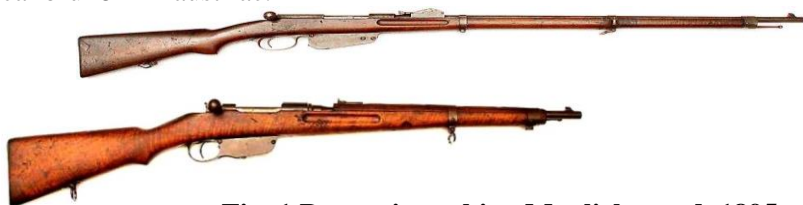
Fig. 1 Pușca și carabina Manlicher md. 1895 cal. 8 mm

Pușca de bază era Manlicher model 1895, sistem similar cu al nostru, dar pe calibrul 8 mm austriac.