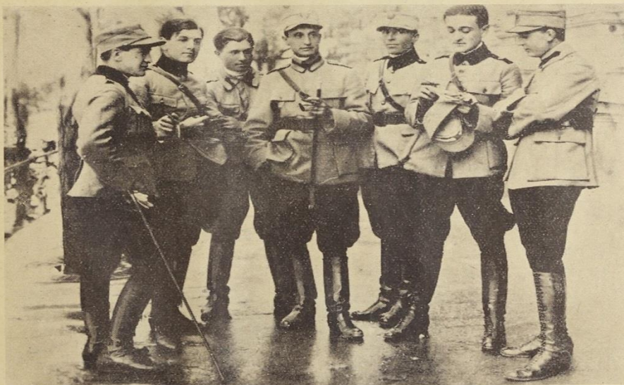
Ofițerii Divizionului I-ii, la Budapesta 1919

Revista trupelor Diviziei 7 Infanterie la Budapesta - 1919