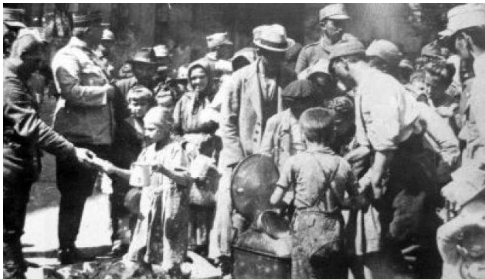
Militari români din Divizia 7 Infanterie Roman distribuind hrană populației civile - Budapesta 1919