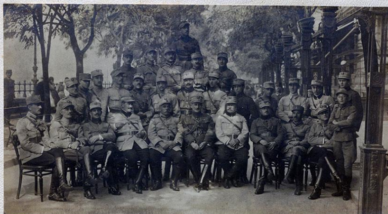
OFİTERII COMANDAMENTULUI DIVIZIEI 7 a (LA HOTEL HUNGÁRIA DIN BUDAPESTA)

Ofițerii Comandamentului Diviziei 7 la Hotel Hungaria din Budapesta