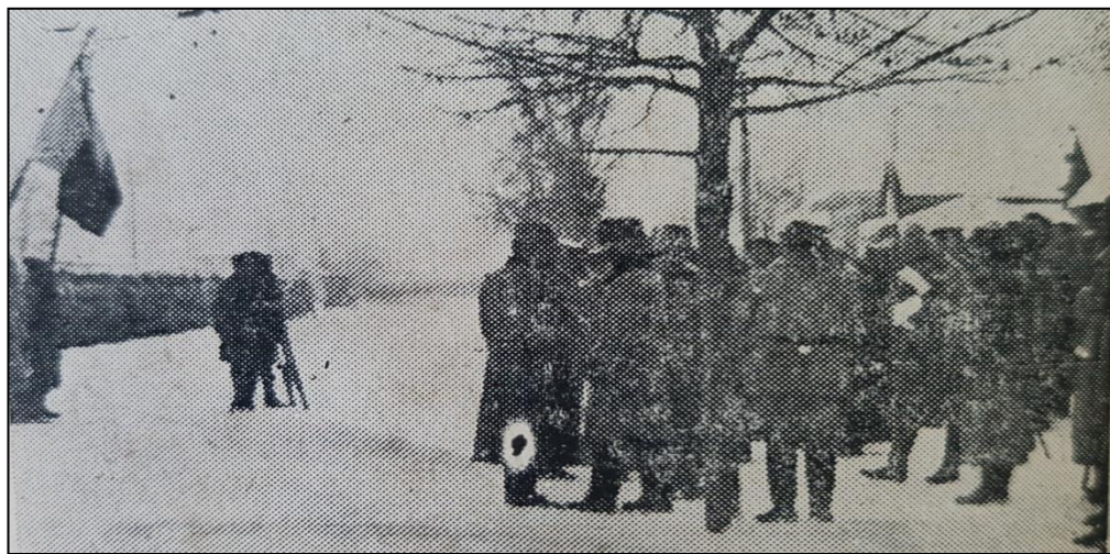
Operator român de cinema pe frontul din Moldova (1917)

Relațiile culturale privilegiate pe care românii le-au avut cu Franța și noua minune a lumii - cinematografia, nu au putut lăsa indiferenți factorii de conducere ai armatei române. Astfel că, în primele decenii ale secolului al XX-lea cinematograful a fost preluat în armată ca mijloc de educație morală, patriotică și de instrucție militară.