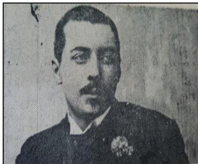
Paul Menu (1876 – 1973), autorul primelor imagini cinematografice realizate în armata română, 1897.

Aceste prime scene filmate la București se încadrau în spiritul epocii. Cu un an înainte, în 1896, rușii filmaseră încoronarea țarului Nicolae al II-lea, iar britanicii montau scene eroice cu armata imperială în războiul anglo - bur.