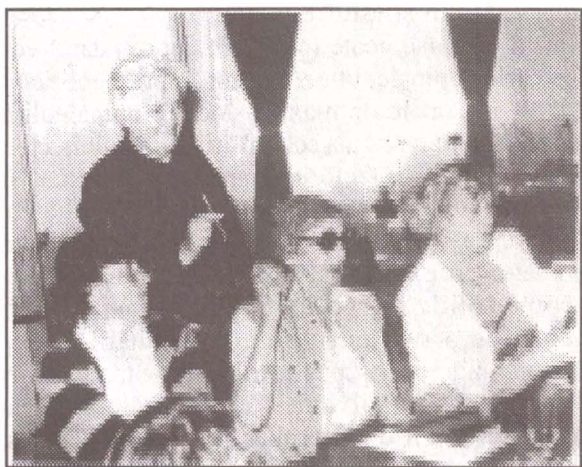
Fig. 2. Aspecte din timpul lucrărilor