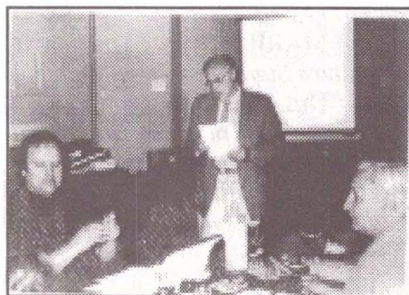
Fig. 1. Aspecte din timpul lucrărilor