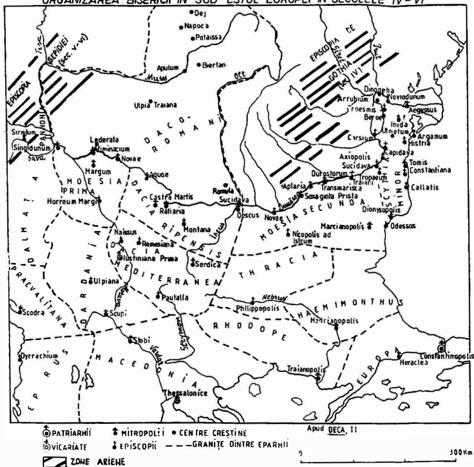
Organizarea bisericii în sud-estul Europei în secolele IV-VI