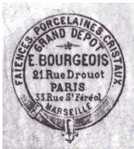
Fig. 2 - 3 Platou Callimachi / Stampa platou Teodor Callimachi