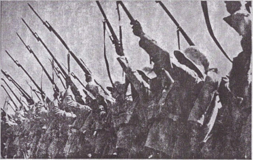
Companie de onoare bulgară trăgând o salvă în momentul îmbarcării croilor români