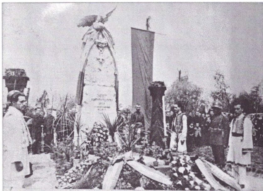
Monumentul croilor români din Sofia 1942