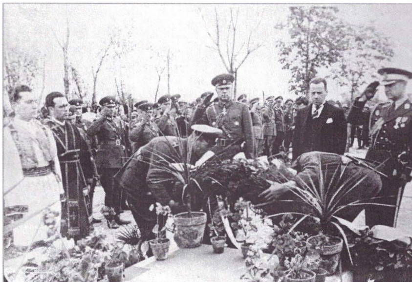
Ceremonia reinhumării croilor români la Sofia 1942