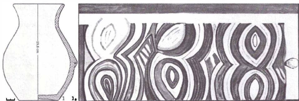
Fig. 1. Plugari - Iazul Nucușor. Vas cu profil în S, pictat tricrom cu negru și roșu pe fond alb. Cucuteni, A 3a .

Fig. 1. Plugari - Iazul Nucușor. S profile pot, tricoloured, black and red on a white background. Cucuteni, A 3a .