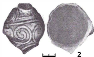
Fig. 2. Plugari - Iazul Nucușor. Capac fragmentar, pictat tricrom cu negru și roșu întins, pe fond alb. Cucuteni, A 3a . Fotografii.

Fig. 2. Plugari - Iazul Nucușor. Fragmented lid, tricoloured, black and red on a white background. Cucuteni, A 3a . Photos.