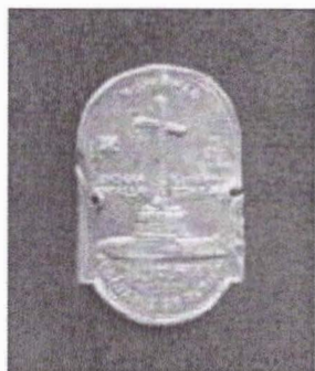
Insigne primite ca urmare a participării al Jamboree