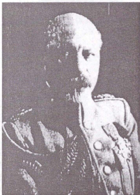
Generalul Constantin Prezan în uniformă de paradă