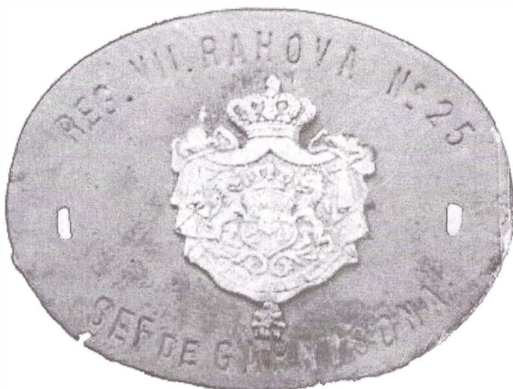
Ecusonul Regimentului VII Racova nr. 25 Vaslui