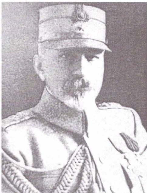
Generalul Constantin Prezan decorat cu ordinul militar „Mihai Viteazul” clasa a III-a, a II-a, a I-a