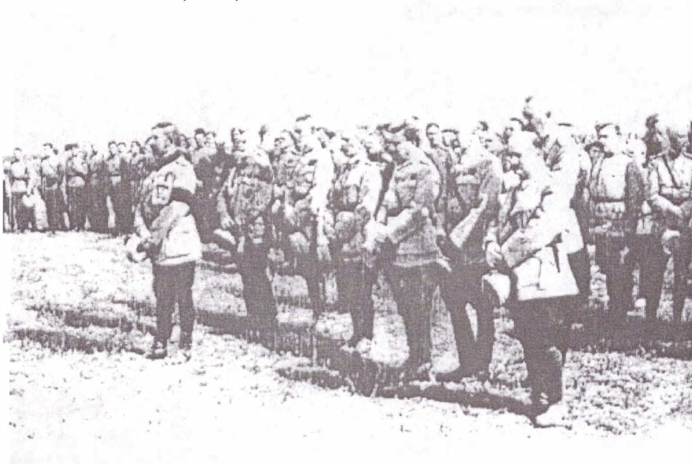
Serviciul religios pe front, Sascut, 1917