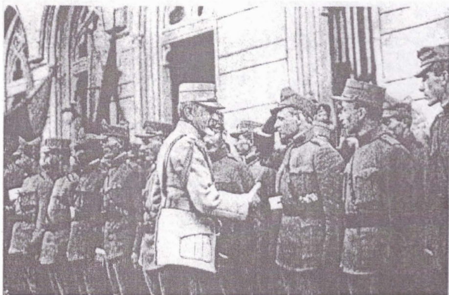
Generalul Prezan urând „bun venit” ofițerilor ardeleni, iunie 1917, Iași