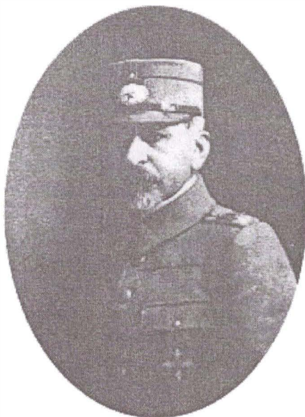
Constantin Prezan, Șeful Marelui Stat Major