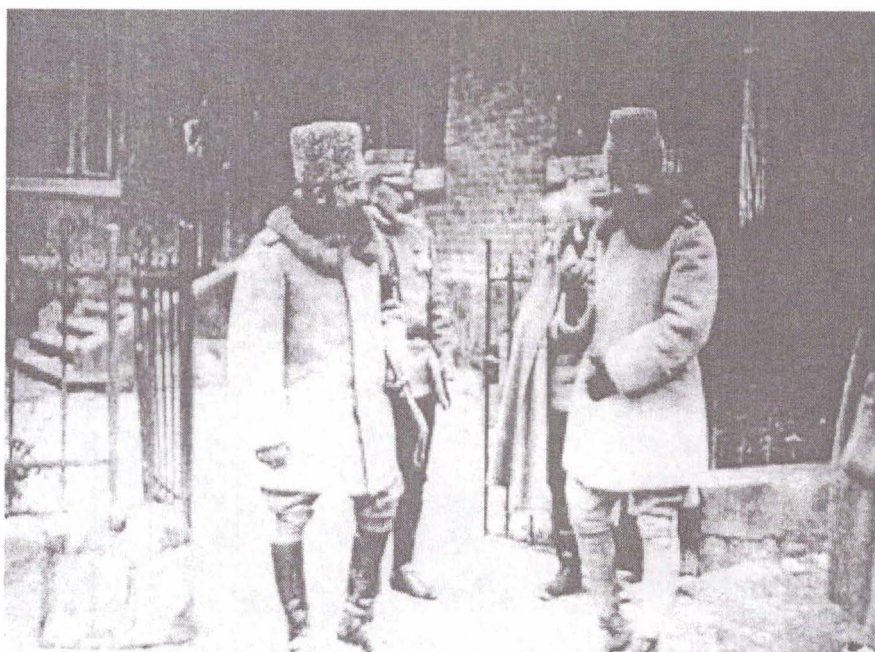
La Marele Cartier General, 28 martie 1918