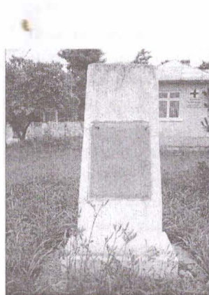
Monumentul eroilor din Muntenii de Sus, județul Vaslui

Starea generală de conservare a construcției este satisfăcătoare, necesitând unele intervenții în vederea restaurării.