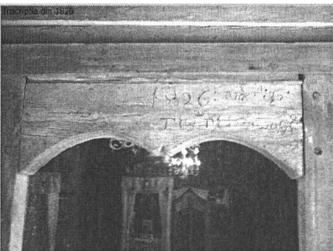
Portala din 1826