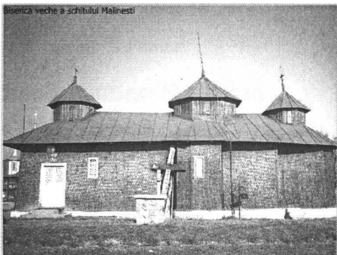
Biserica veche a schitului Malinesti