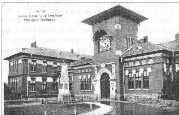
Școala normală de băieți "Principele Ferdinand"