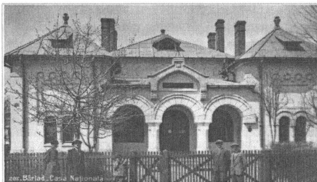
Casa Națională "Stroe Belloescu"