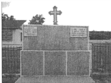
Monumentul eroilor de la Școala cu clasele I-IV din Satu-Nou

Aflându-se în fața Școlii cu cl. I- IV din Satu-Nou (parcele 82/1) din strada Safir, monumentul se află în administrația Consiliului local al comunei Muntenii de Sus.