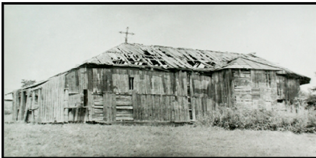
Vechea biserică de lemn din Laza*

De mare importanță sunt inventarele 507 făcute de părintele Burcă în 1884 și 1889. Scrierea acestora, cerută de forurile superioare, avea drept scop cunoașterea clară a întregului patrimoniu, a tuturor lucrurilor ce aparțineau bisericii; în caz de furt,