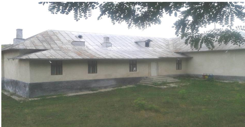
Școala Primară din Muntenii de Sus- 2016 (nefuncțională)