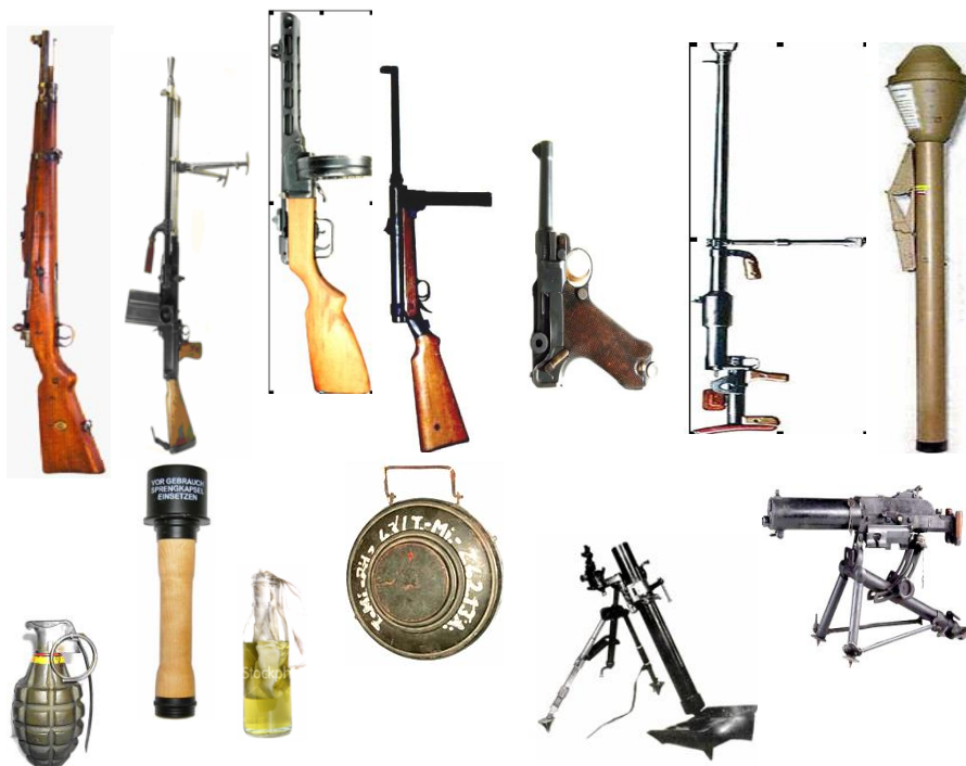
Armele companiei de armament greu regimentar

Ca mitralieră a fost preferat modelul Scwartzlose transformat. Aceasta, răcită cu apă și având o cadență mai mică, putea să tragă 400 de cartușe fără pauză, spre deosebire de modelul ZB-53 răcit cu aer, care avea nevoie de pauză după 50 de focuri. De asemenea, ca material de aruncătoare s-a ales piesa Brandt-Voina cal.60mm, mai ușor de purtat, plutonul putând să transporte un număr mai mare de lovituri.