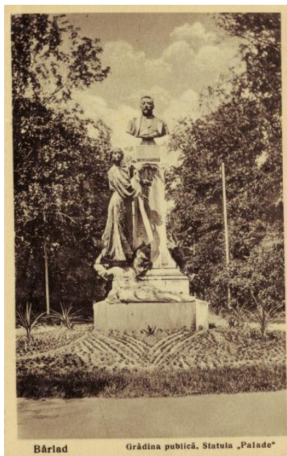
Bârlad Grădina publică, Statuia „Palade”