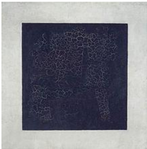
Kasimir Malevitch, Pătrat negru pe un fond alb (1915)

În 1915, Malevitch pictează trei elemente pe care le va include mai târziu printre elementele fondatoare ale suprematismului: Pătratul negru, Crucea neagră și Cercul negru. Folosind forme simple cu caracter geometric și unicolore dispuse pe pânză sau construite în realitate (arhitectone), suprematismul arată caracterul infinit al spațiului și relația de atracție și respingere a formelor. Malevitch caută simplificarea extremă și ajunge astfel la faimosul Pătrat negru pe fond alb.