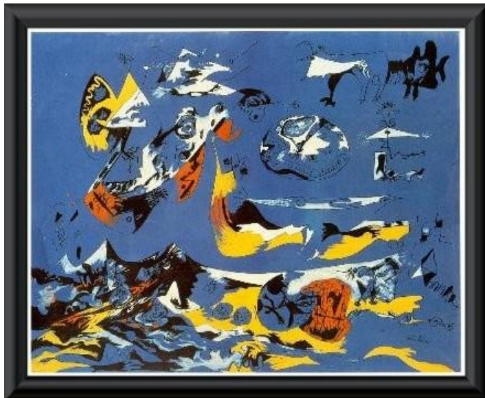
Jackson Pollock 1912-1956, Blue Moby Dick (1943)

gestuală», Pollock, Kline și Kooning sunt artiștii americani în a căror artă se resimte influența lui Mondrian sau a lui Masson 1 .