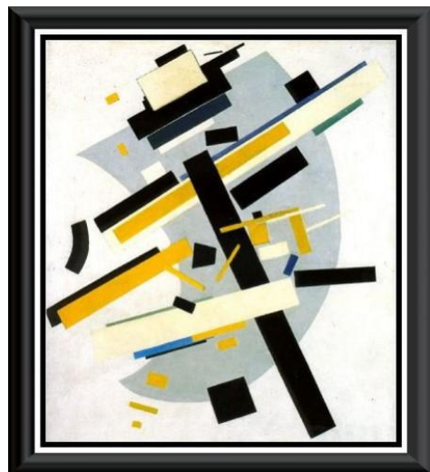
Kasimir Malevitch, Supremus N° 58 - Galben și negru (1916)

Pentru acești trei artiști, trecerea de la figurat la abstract s-a făcut destul de lent între 1910 și 1917. Dar aceasta tendință în artă va fi pregătită de evoluția generală a epocii care va fonda de asemeni cubismul, raionismul, futurismul. Abstracția n-a fost o revelație izolată, ea face parte dintr-un context global extrem de creativ în toate manifestările artistice. Cu toate acestea, abstracția rămâne arta cea mai dificil acceptată de public deoarece un asemenea tablou n-ar reprezenta «nimic», lucru ce șochează uneori gusturile și obiceiurile în aprecierea artei. O pictură abstractă trebuie abordată într-un spirit diferit de operele figurative.