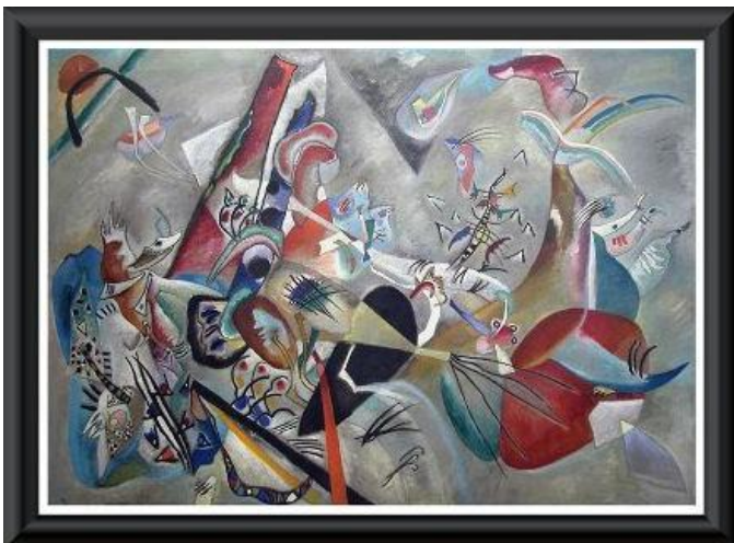
Vassili Kandinsky, În gri (1919), ulei/pânză 129 x 176 cm