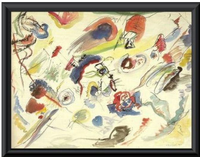
Vassili Kandinsky, Fara titlu , Prima acuarela abstracta (1910-1913)

Tot el consideră că formele și culorile puteau comunica adevăruri spirituale, ascunse în spatele aparențelor cotidiene, dificil de descris în cuvinte. De asemenea, artistul vede o similitudine între muzică și pictură. Pentru el: „culoarea reprezintă clapele. Ochiul este ciocanul. Sufletul este pianul cu numeroasele lui corzi. Artistul este mâna care face sufletul să vibreze prin intermediul unei clape sau a altea” 3 .