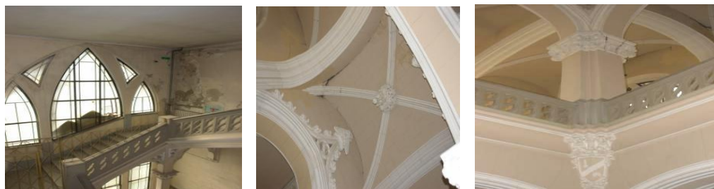
Deteriorări la etajul I

anii 1997-1998 s-au făcut subzidiri la fundațiile adiacente acestor turnuri, pe o lungime de circa 40 de metri.