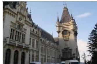
Fațada principală (dreapta)

Discuțiile în vederea începerii uriașei construcții au început în 1904. Totul a fost legat de pierderea statutului de capitală a Iașiului, prin renunțarea din vremea „Unirii mici”, de la 1859, când „trebile țării” se mută la București. În prima sa vizită în orașul de pe Bahlui, după ce acesta n-a mai fost capitală, regele Carol I a fost plăcut surprins de tot ceea ce cultura lăsase în orașul moldav. De aceea, la plecare, a promis că va sprijini Iașiul să se mențină măcar ca o capitală culturală și spirituală a țării. „Pentru că nu mai exista vechiul Palat Administrativ, ars în 1878, Carol I le-a promis ieșenilor sprijin pentru realizarea unui Palat Administrativ și de Justiție. Construcția a început în 1906, dar a fost întreruptă în timpul Primului Război Mondial, când acolo au fost încartiruite trupele, iar imobilul neterminat a devenit spital de campanie. După război, distrugerile au fost masive, de aceea constructorii au trebuit s-o ia de la capăt. Fondurile destinate construcției au fost alocate de Fundațiunea „Carol I”.