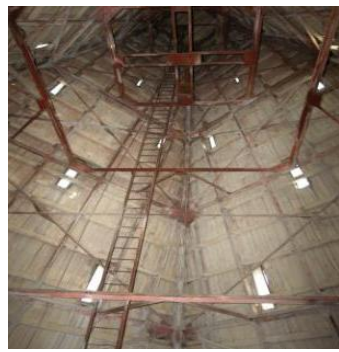
Deteriorări la Turnul cu ceas

În urma cutremurului din 1977 s-au constatat următoarele avarii: ruperea zidului longitudinal al aripei de est de structură până la nivelul planșeului, fisuri și crăpături în arce, bolți și zidărie, evidențierea prin fisuri a golurilor modificate, fisurarea ornamentației de ipsos, deformări și deplasări la șarpantă. Din aceste motive s-a intervenit prin executarea unor centuri și buiandrugi din beton armat, cămășuirea unor arce, montarea de tiranți, practicarea de noi goluri pentru amenajări în cadrul muzeului, desfaceri și refaceri de ziduri puternic avariate, cămășuirea pilaștrilor de la turnuri și intrări. O serie de lucrări au rămas nefinalizate, cum ar fi: consolidarea turnurilor de colț posterior, înlocuirea învelitorii, reparația unor ziduri transversale în zona de sud. Degradările s-au accentuat după cutremurul din 31 august 1986. Astfel au apărut fisuri și crăpături, chiar degradări importante în pereți, tavane, elemente ornamentale. După cutremurul din 1990 au fost luate o serie de alte măsuri de consolidare, în special în zona aripei de sud a clădirii, la turnurile de colț. Astfel în anul 1996 s-au cămășuit la interior aceste turnuri de colț de pe fațada posterioară și în