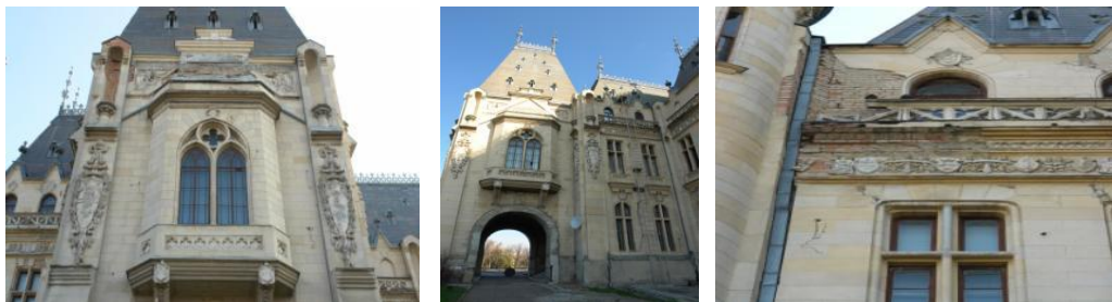
Tencuieli deteriorate la fațada principală

În unele zone s-au înregistrat tasări și deplasări ale pardoselilor.