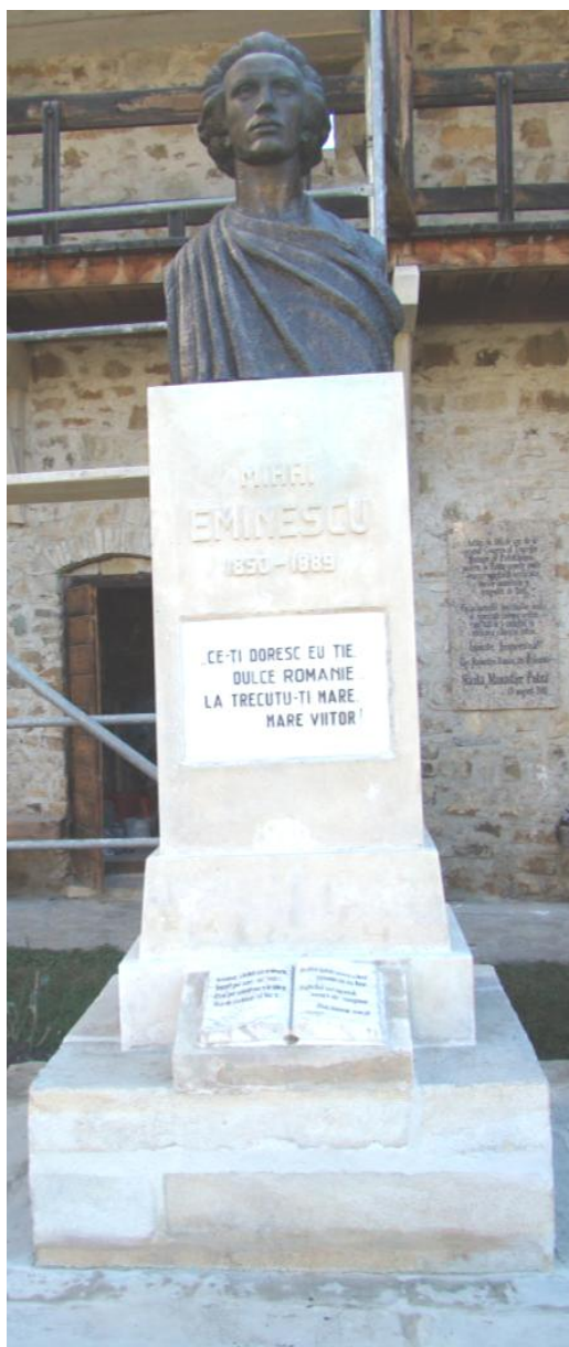
Fisură în zona centrală a lucrării remediată și monumentul după restaurare