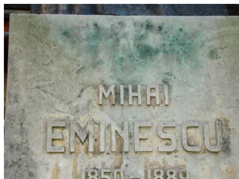
Aspecte ale deteriorărilor întâlnite la lucrare și la soclul monumentului