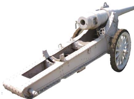
Tun de asediu Krupp md 1885/1891 cal 150 pe afet

Artileria antiaeriană cu 113 piese era realizată tot prin modificări făcute în țară la tunuri de câmp sau de fortificații (cal 57mm și cal 75mm), mai puțin 8 piese din import.