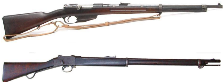
Puști Manlicher md93 cal 6.5 și Henry-Martini md79 cal 11.43

La 15 august 1916, data intrării României în război (stil vechi), armata română era echipată cu cca. 374 000 puști Mannlicher și 142 000 puști Henri-Martini 866 . Cu mari dificultăți s-au putut lansa comenzi pentru numai 10 000 de arme franceze Berthier md.1907/15.