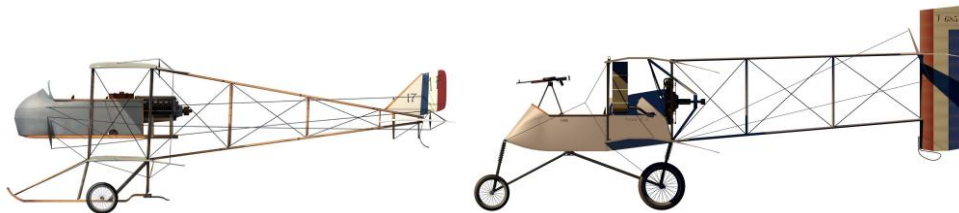
Avioane de recunoaștere și bombardament ușor Maurice Farman MF-7 și Voisin-8

Din Anglia nu s-a obținut mai nimic până la semnarea acordului de la St. Petersburg, în plus calibrele erau incompatibile.