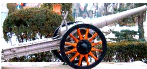
Tun de însoțire Hotchkiss cal.57 md 1888/1916 868

Pentru a suplini puterea de foc mai mică a unităților românești, s-a realizat o artilerie de însoțire, prin adaptarea pe afete construite în țară a tunurilor ușoare (53 și 57mm) luate din fortificațiile permanente 867 . Un număr de 336 de astfel de tunuri au fost atașate la brigăzile de infanterie.