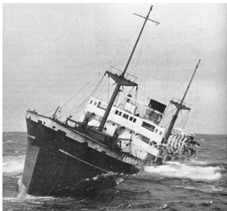
Cargoul BISTRITA – 3.700 trb – lansat în 1915

Ruta estică nu era expusă la submarine, dar era înfiorător de lungă: imensului traseu trans-pacific se adăugau 11.000 km de trans-siberian. Nici un grafic nu putea fi respectat și practic, conținutul depozitelor noastre de la Odessa reprezenta totdeauna o surpriză și pentru responsabilii noștri. În plus, cu Rusia aflată în război, utilizând aceleași surse de aprovizionare, nu exista transport „nevămuit”, astfel că mai puțin de 50% din mărfuri ajungeau la destinație.