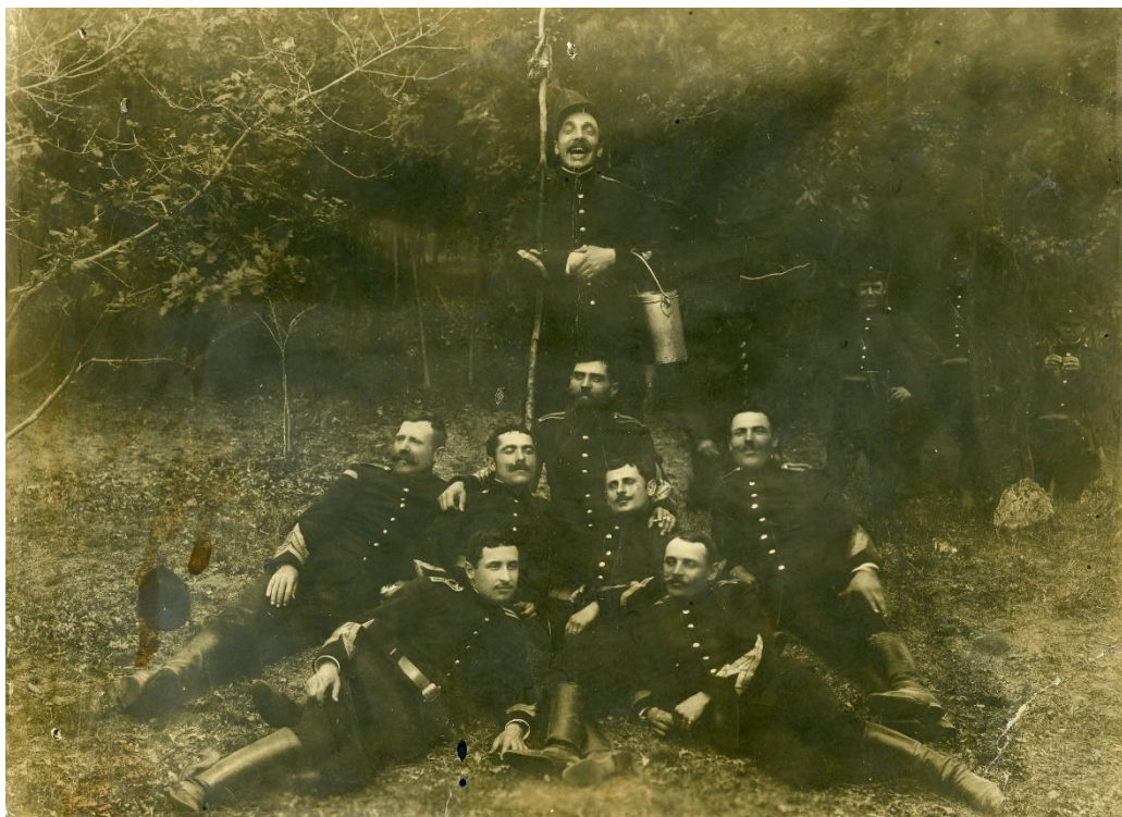
Constantin Tănase cu camarazii de armată (Muzeul Județean „Ștefan cel Mare” Vaslui, nr. inv. 546)