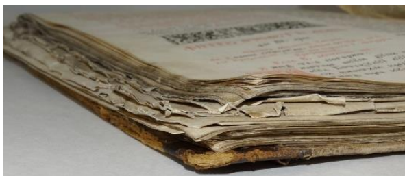
Fig. 3. Degradări ale tranșelor