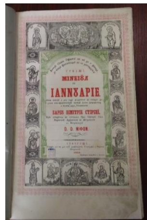
Fig. 9. Fila de titlu după restaurare