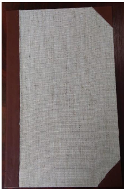
Fig. 11. Volumul după restaurare