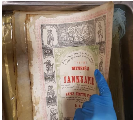
Fig. 6. Curățare umedă prin imersie