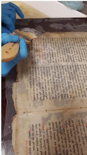
Fig. 7. Spălarea filelor cu nuci de săpun