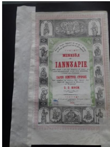
Fig. 8. Fila de titlu-fază intermediară