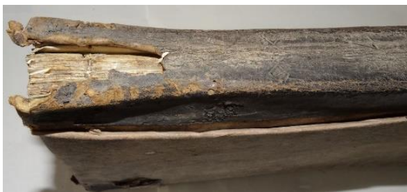
Fig. 4. Degradarea cotorului - detaliu