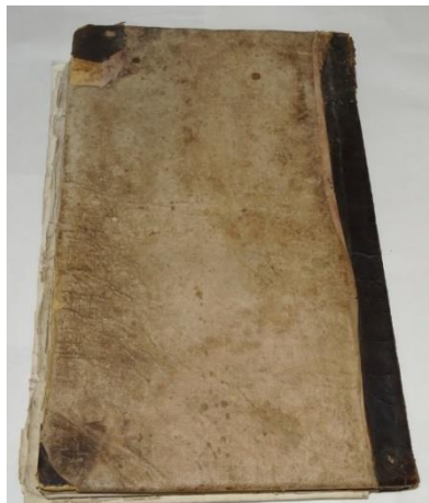
Fig. 1. Coperta înainte de restaurare