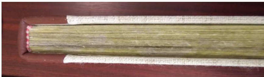
Fig. 10. Capitalbandul