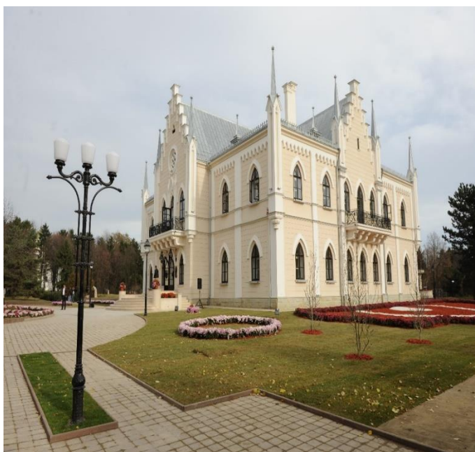
Fig. 8 - Palatul de la Ruginoasa, după procesul de restaurare din anul 2013