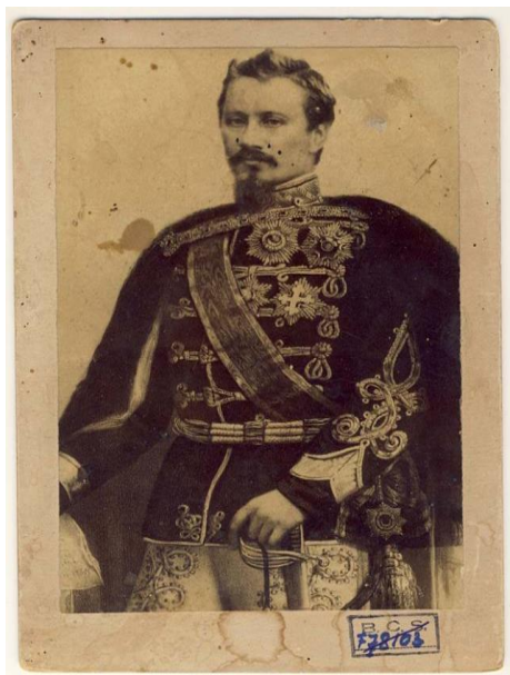
Fig. 5 - Alexandru Ioan Cuza