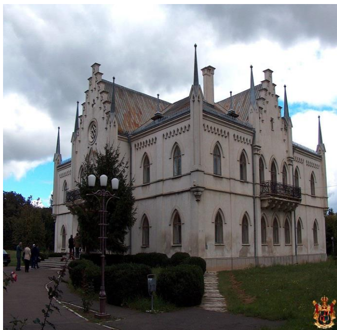
Fig. 7 - Palatul de la Ruginoasa în anul 1990