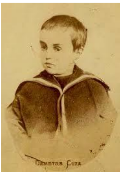
Fig. 4 - Prințul Dimitrie Cuza