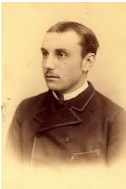
Fig. 3 - Prințul Alexandru Cuza