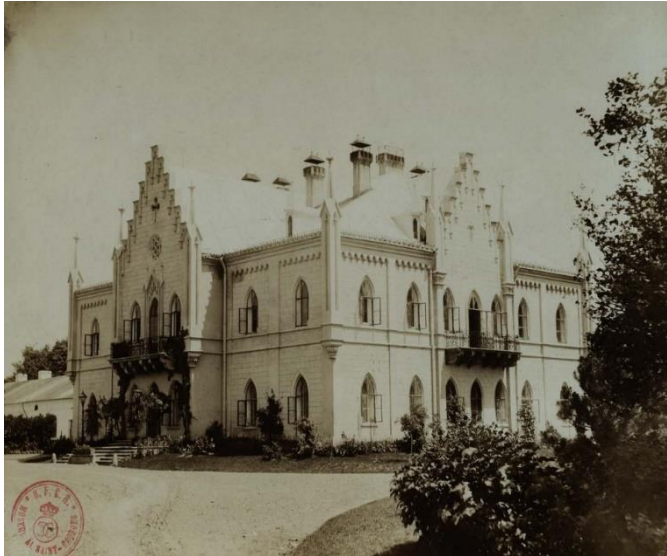
Fig.1 - Palatul de la Ruginoasa în anul 1892

Urmând un amplu și minuțios proces de redefinire tematică a expoziției permanente și reamenajare a spațiului expozițional, Muzeul Memorial Alexandru Ioan Cuza de la Ruginoasa revine în circuitul muzeal național, mai viu ca niciodată.