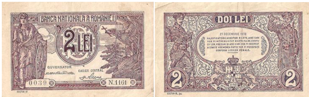
2 lei 1938 (tip I, martie 1915 - decembrie 1938)

Bancnota de 1 leu, tip I, a avut patru emisiuni: 12 martie 1915, 17 iulie 1920, 28 octombrie 1937, 21 decembrie 1938 47 .