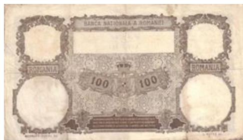
100 lei 1931 1 avers (tip II, ianuarie 1910 - ianuarie 1942) ianuarie 1942)