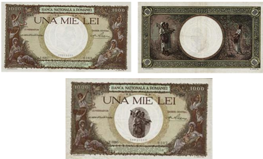
1000 lei 40 (tip IV, iunie 1936-noiembrie 1940, versiunea I)

Demersurile pentru emiterea unei noi bancnote de 1000 de lei au început din toamna anului 1934 când se hotărăște folosirea a două acuarele realizate de N. Grigorescu, adaptate la cerințele tehnologice de Ary Murnu. În ianuarie 1935 sunt trimise la Paris două fotografii cu desenele originale ale desenelor lui N. Grigorescu și E. Gasperini începe să lucreze la realizarea gravurii clișeele, activitate finalizată în septembrie 1935 când toate clișeele ajung la atelierelor de imprimare din București 39 .