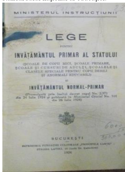
Legea pentru învățământul primar al statului și învățământul normal primar (26 iulie 1924)

„Legea pentru învățământul primar al statului și învățământul normal primar” din 26 iulie 1924, a oferit școlii primare o organizare unitară și în același timp a dat dreptul minorităților să studieze în limbile respective. Astfel, a stabilit cele trei trepte ale învățământului primar: școlile (grădinițele) de copii mici, școala primară propriu-zisă și cursurile de adulți, școlile și clasele speciale pentru copii debili și anormali educabili și școlile normale. Din cuprinsul legii distingem principiile moderne care au stat la baza organizării învățământului primar, printre care și unificarea învățământului pe tot cuprinsul țării, obligativitatea și gratuitatea acestuia cu stabilirea etapelor de vârstă specifice fiecărui grad, caracterul practic care reiese din programa școlară, adaptată mediului și vârstei școlarului, prin care s-a urmărit îndeosebi ridicarea standardului național al educației.