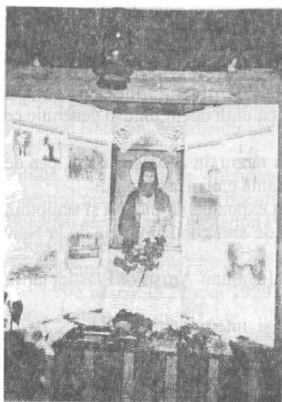
Tinda Casei "Sf. Ioan Iacob-Hozevitul"