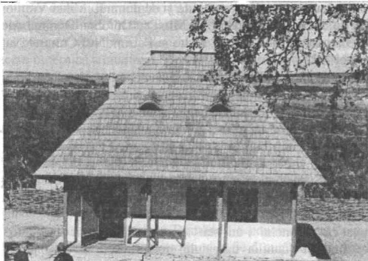
Casa reconstruită "St. Ioan la Cuviosul După sfințirea din 6 septembrie 2003