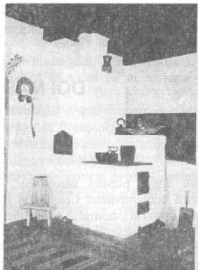
Interior cameră Casa "Sf. Ioan Iacob-Hozevitul"