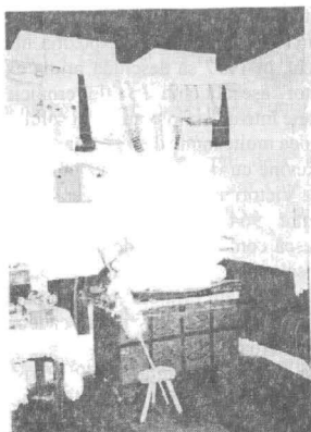
Interior cameră Casa "Sf. Ioan Iacob-Hozevitul"