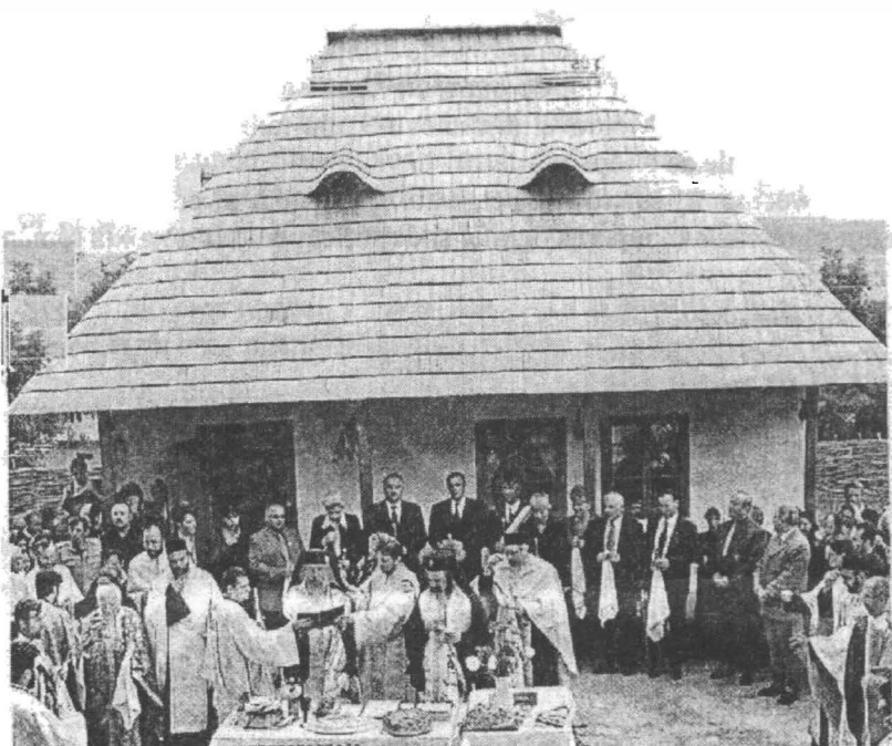
Sfințirea casei Cuviosului Ioan Iacob-Hozevitul