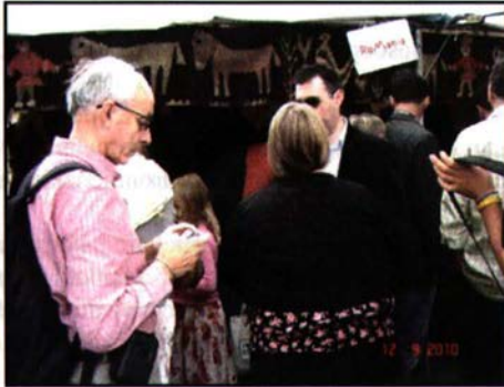
Standul românesc pe malul Tamisei