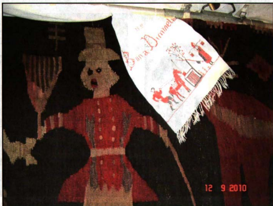
Țesături de interior