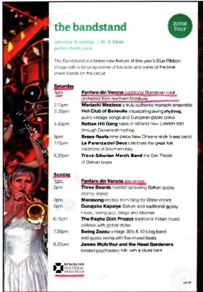
Fanfara de la Vorona – ZONA 4