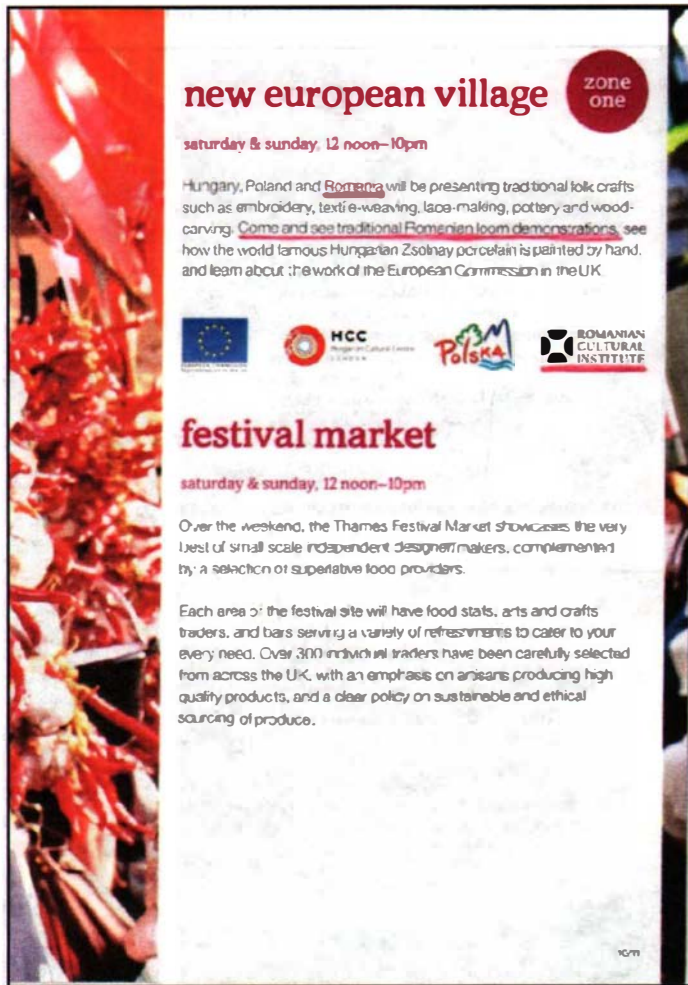
Noul sat european (New European Village) – ZONA 1