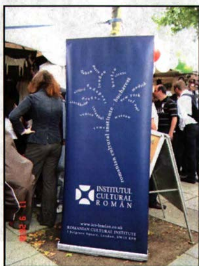
Standul românesc pe malul Tamisei