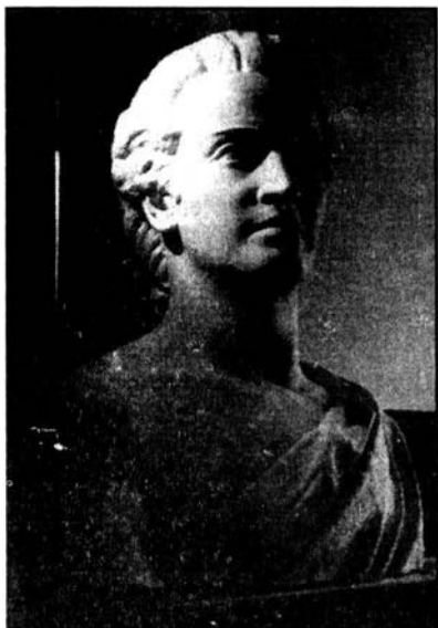
BUSTUL LUI EMINESCU (GHIPS) rămas în sala Primăriei din Cernăuți, 1940