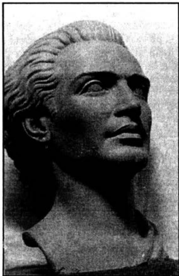
BUSTUL LUI MIHAI EMINESCU executat la București, 1958

Se cuvine ca și autoritățile administrative din municipiul Dorohoi și comuna Suharău să omagieze personalitatea artistului, cu prilejul aniversării dându-i numele unei străzi sau instituții de cultură și dezvelindu-i un bust într-un loc corespunzător spre fi pildă generațiilor tinere.