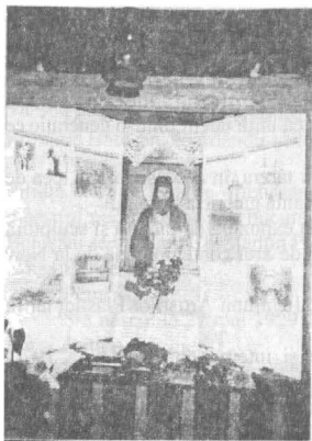
Tinda Casei "Sf. Ioan Iacob-Hozevitul"