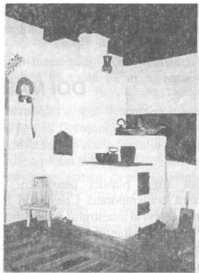
Interior cameră Casa "Sf. Ioan Iacob-Hozevitul"